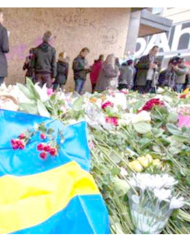
زهور: سويديون يضعون الزهور والعلم في موقع حادث الدهس

□ ستوكهولم، (ا ف ب) - أعلن وزير العدل السويدي مورغان يوهانسون في مقابلة مع وكالة فرانس برس امس ان بلاده تعزز تشديد قوانين مكافحة الإرهاب بعد الاعتداء الإرهابي الذي استهدف العاصمة ستوكهولم الجمعة ووقع أربعة قتلى و15 جرحياً.