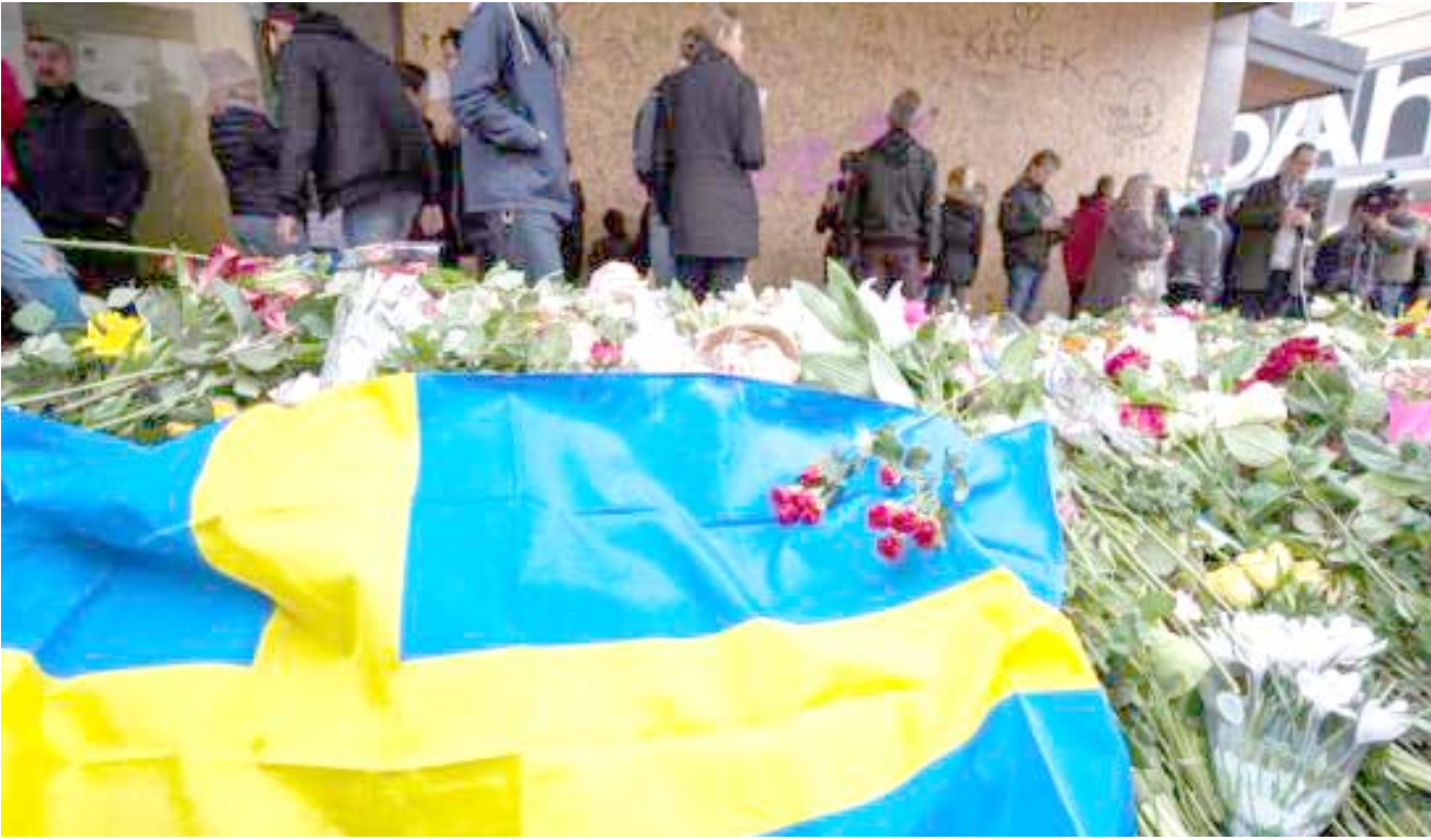
زهور: سويديون يضعون الزهور والعلم في موقع حادث الدهس

وقوانين مكافحة الإرهاب لقد جرّمنا المغادرة الى الخارج المرتبطة بالارهاب، ووسّعنا (هامش الملاحقات) في تمويل الإرهاب، ثمة هامش لتوسيع (القانون) في شكل أكبر. وأوضح انه يمكن للمره ان يكون ناشطاً في تنظيم إرهابي حتى إذا لم يشارك في عمل محدد. يمكن