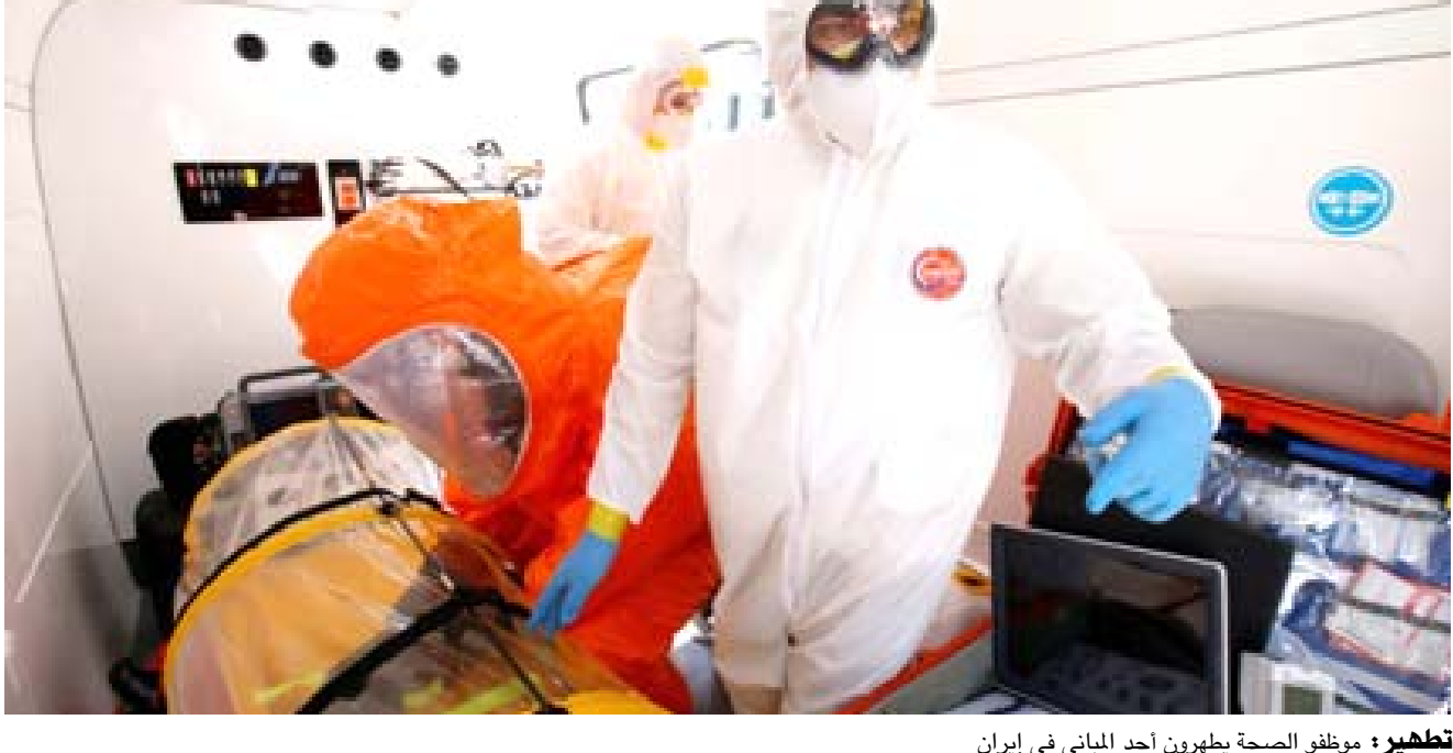
تظهر: موظفو الصحة يطهرون أحد المباني في إيران

وأعلن نائب رئيس البرلمان الإيراني، عبد الرضا صمري، ارتفاع عدد النواب المصابين بكورونا إلى 23 نائباً، بعد إجراء الاختبارات الطبية اللازمة لهم. ونقلت وكالة نادي المرسلين الشباب الحكومية الإيرانية عن صمري قوله إن إصابات هؤلاء النواب جاءت لأنهم كانوا على اتصال وثيق بأشخاص يحملون الفيروس. ولم يذكر صمري أسماء النواب المصابين، لكن أسماء خمسة نواب كانت قد كشفت سابقاً وهم كل من قاسم ميرزائي نكو ومجتهد نو النور ومحمود صادقي وأحمد اميرابادي قراهاني ومصعوب آقا بون. ونصح النائب الإيراني زملاؤه المنتخبين البرلمان الجديد، بإبطع علاقتهم مع الناس في الوقت الحالي تجنباً للإصابة بكورونا. (كما أنه سترت عادت وسجلت الإثنى عشر نائبة ملقطة وسط فرق المستعمرين ان تضع السلطات النقدية في الدول الكبرى رداً منسقا بخفف من وطأة الوباء على الاقتصاد. وفتحت النورسات الآسيوية الرئيسية الثلاثة على ارتفاع فسخل مؤشر نيكيا،