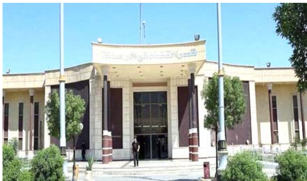
مبنى محكمة إستئناف بغداد / الرصافة

وأصدرت محكمة جنابات الكرخ برئاسة استئناف بغداد/ الكرخ الاتحادية حكماً بالإعدام شنقاً حتى الموت بحق الإرهابي المكنى بـ (همام) أقدم من جملة أفعاله على إغتصاب فتاة أيزيدية أثناء اجتياح المصائب الإرهابية لحفاظة نينوى. وأعاد مراسل المركز الإعلامي لمجلس القضاء الأعلى أمس أن (المشككة) الأيزيدية أهداهما التنظيم الإرهابي إلى الحرم كسبية مكافأة له على جرحه في إحدى المعارك مع القوات الأمنية العراقية). وأضاف أن (المحكمة حكمت على الإرهابي بالإعدام شنقاً وفقاً لإحكام المادة الرابعة / 2 من قانون مكافحة الإرهاب رقم 13 لسنة 2005).