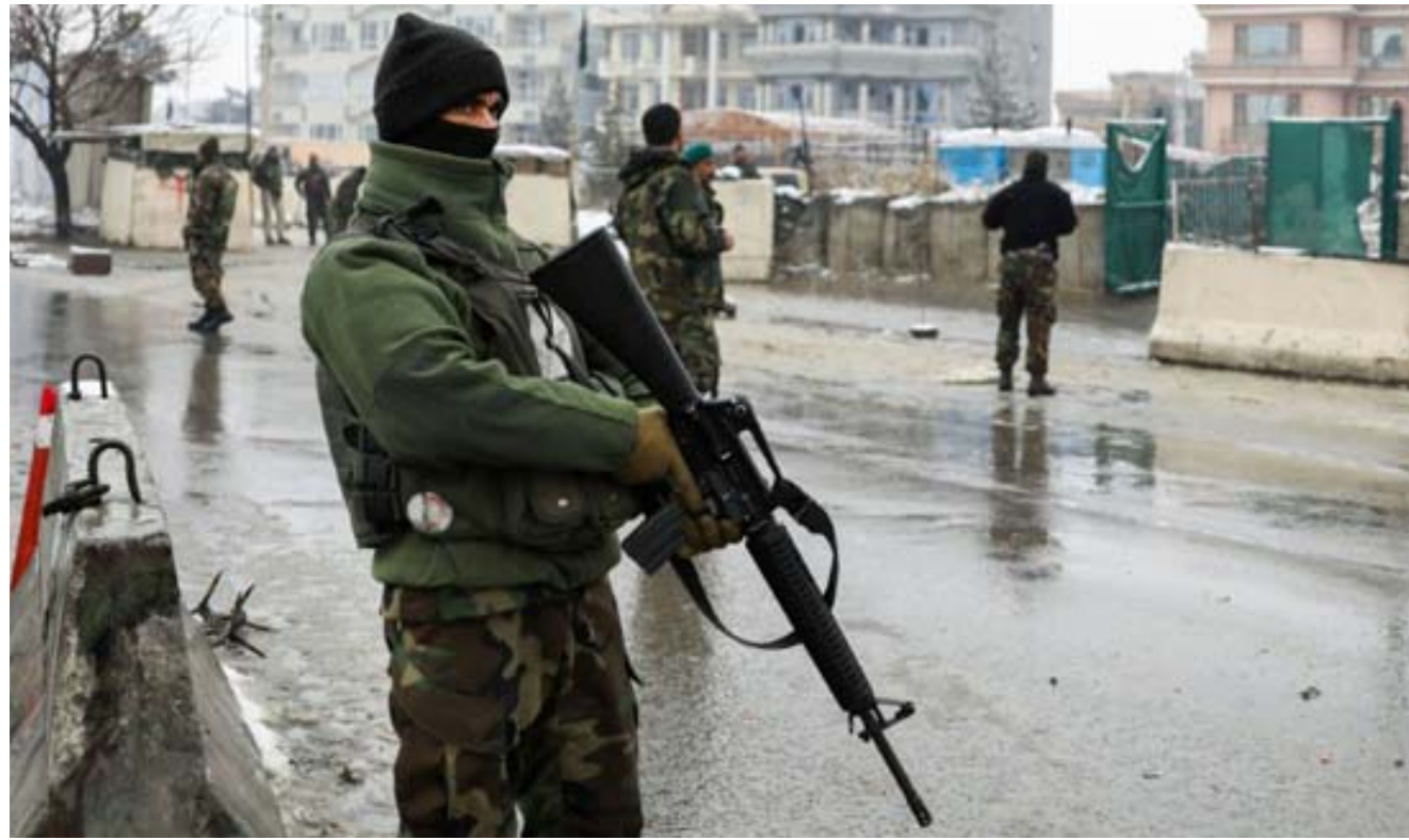
وقف: قوى أمنية أفغانية في مكان وقع فيه تفجير انتحاري

طالبان لتنظيم القاعدة على ارض أفغانستان السيد الرئيسي للغزو الاميركي في اغتاف حصمات 11 ايلول/سبتمبر عام 2001. وطرد تحالف دولي بقيادة الولايات المتحدة الحركة من السلطة بعد الهجمات، ونفذ المتطرفون الذين كانوا يحكمون كابول منذ 1996 وحتى تشرين الاول/أكتوبر 2001 هجمات متواصلة اودت بحياة أكثر من 2400 جندي اميركي وعشرات الاف من أفراد قوات الأمن الأفغانية، وانفقت واشنطن أكثر من الف مليار دولار في الحرب التي قُتل واصيب فيها أكثر من مئة الاف مدني أفغاني منذ 2009 حسب ارقام الأمم المتحدة.