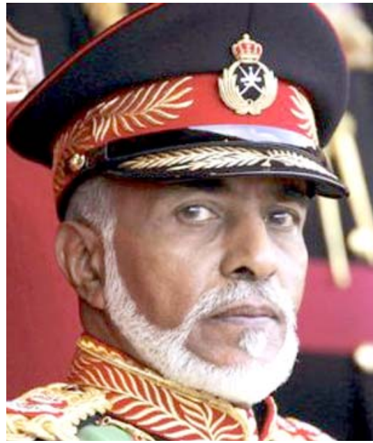
هيثم بن طارق