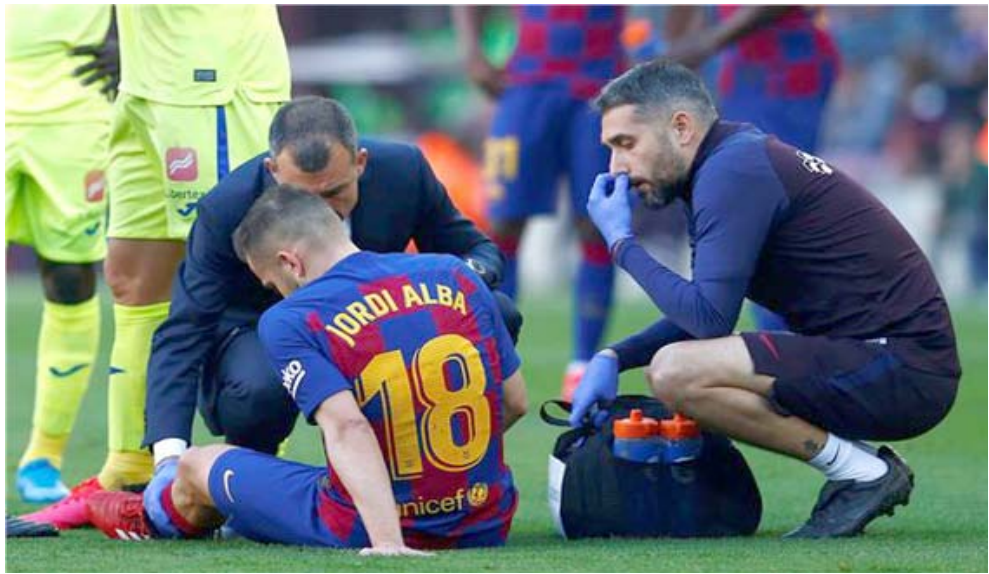
تفاس: مازال فريق برشلونة يتنافس غريمه ريال مدريد لصداره الليغا

الجزء، ومرة الكرة بجانب القائم الأيمن للحراس سوريا في الدقيقة 90. وفشلت انتفاضة خيتافي لحاوله اقتناص التعادل، لتنتهي المباراة بفوز البلوجرانا وحصد النقاط الثلاث.