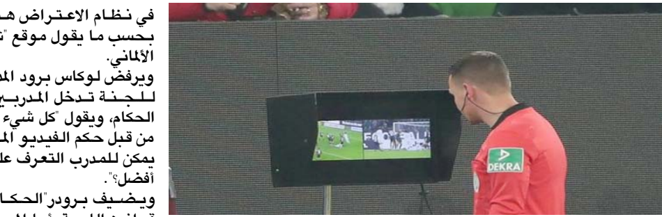
جان من استخدام الحكام تقنية الفيديو

ويضيف برودر الحكام خبراء في قوانين اللعبة، أما المدربون فليسوا دائما خبراء، ومبدأ القرار هو أن يساعد الحكم بعضهم البعض وليس أن يقو شخص من الخارج بالتشكيك في القرارات. وتابع يمكن للمدربين أن يستغلوا نظام الاعتراض من أجل تعطيل اللعب أو مضايقة اللاعبين أو طواقم الفريق شپورت شاو.