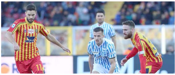
من مباراة ليتشي وسبيل

السبت على ملعب "فيا ديل ماري"، في مستهل الجولة الـ 24 من عمر المسابقة وأنهى أصحاب الضيافة 45 دقيقة الأولى متقدمين بهدف