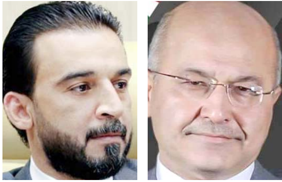
بغداد - الزمان