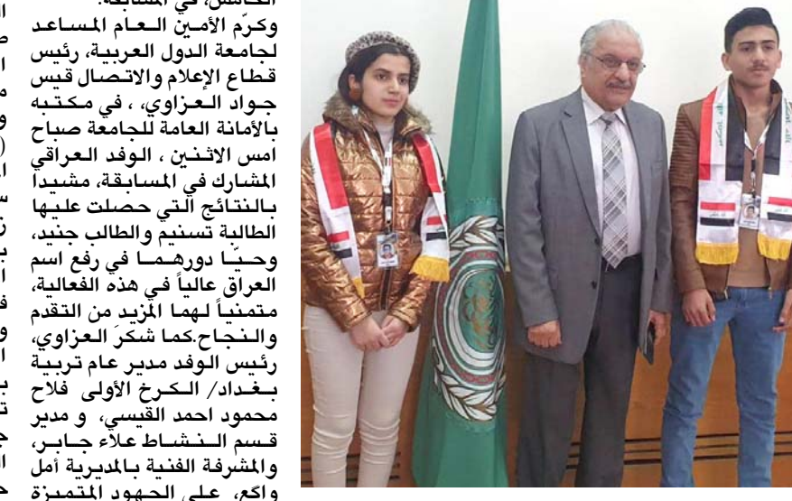
جائزة : الطالبة العراقية التي فازت بالجائزة وزميلها يتوسطهم مسؤولا في الجامعة العربية

بغداد - الزمان رجحت الهيئة العامة للأنواء الجوية والرصد الزلزالي التابعة لوزارة النقل استمرار الموجة الباردة حتى يوم الجمعة المقبلة، مشيرة الى طقس اليوم الثلاثاء في المناطق كافة سيكون بارداً مصحوباً بأمطار وثلوج. وقالت الهيئة في بيان امس ان (طقس اليوم الثلاثاء في المنطقتين الوسطى والشمالية سيكون غائماً مع تساقط زخات مطر وثلوج ثم تحسن بعد الظهر). وأضاف ان (طقس المنطقة الجنوبية غائم مع فرصة تساقط زخات مطر وثلوج خفيفة في بعض الاقسام الشرقية ثم يتحسن بعد ذلك ودرجات الحرارة تنخفض قليلاً). وتوقع مئني جوي دورة الموجة الباردة الشديدة التي تضرب العراق حالياً وتنخفض فيها درجات الحرارة الى ما دون الصفر المئوي وكتب صادق عطية في