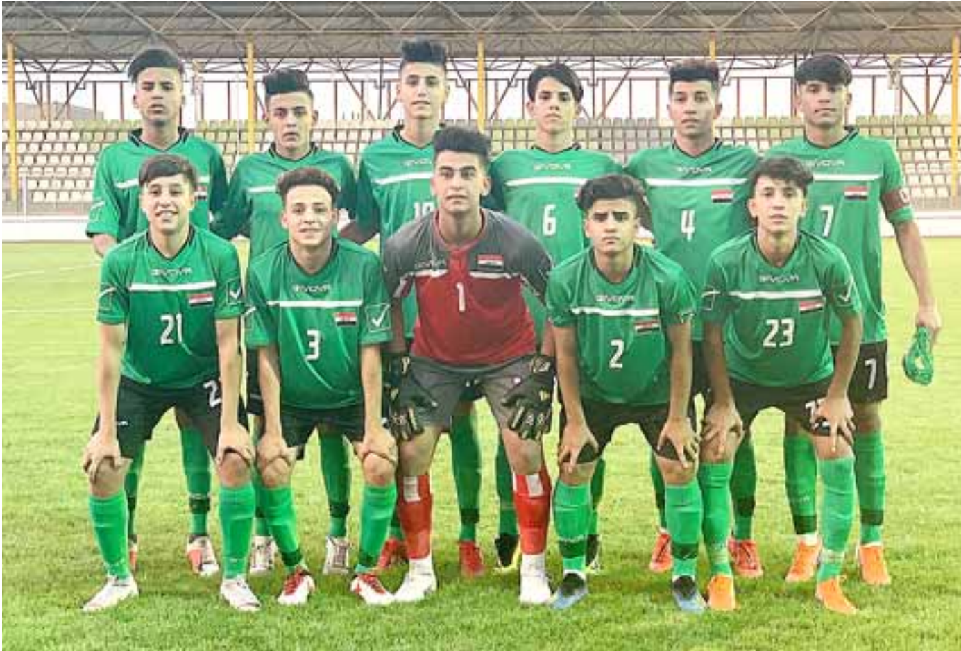
حظوظ : يستعد منتخب الشيا لقص شريط منافسة بطولة العرب