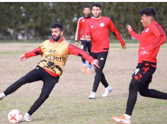
وتيرة: الزوراء يرفع وتيرة تحضيراته للدوري