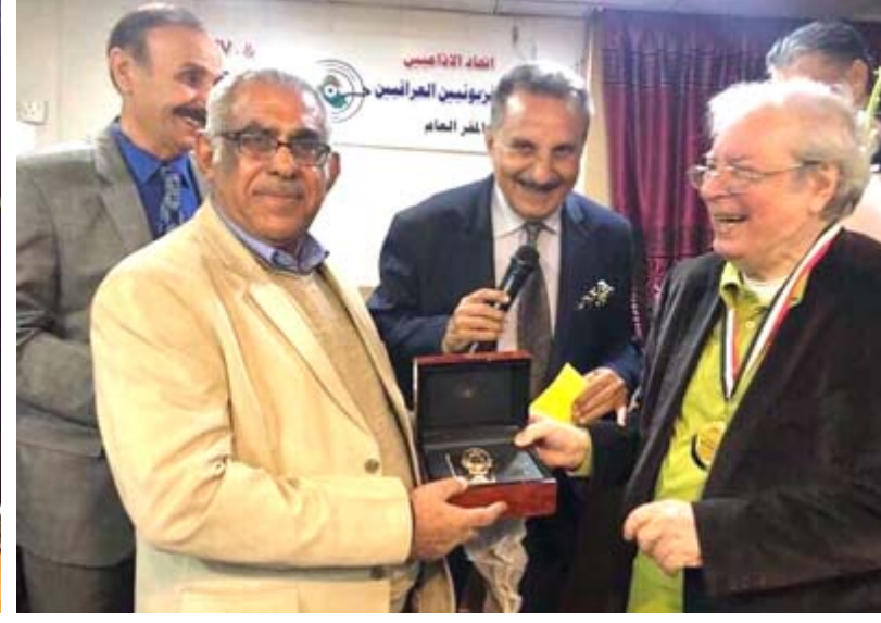
مسيرة إبداع: إتحاد الإذاعيين والتلفزيونيين يحيي بفيلس الياسري