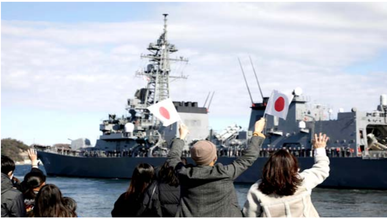
مدمرة: أشخاص يلوحون بإيديهم دى مغادرة المدمرة اليابانية من قاعدة يوكوسوكا متجهة إلى الشرق الأوسط

أطلقت باريس وندن وبرلين في كانون الثاني/يناير آية تفعيل الزعامات الواردة في هذه الوثيقة. ويمكن أن تؤدي هذه الآلية إلى إعادة فرض كل العقوبات التي أقرها مجلس الأمن الدولي من قبل ورفعت بموجب اتفاق فيينا. لكن العواصم الأوروبية الثلاثة تؤكد أن هذا ليس هدفاً. وحذرت طهران من جهتها منذ فترة طويلة من أن إقالة المف النووي على مجلس الأمن سيؤدي موت اتفاق فيينا نهائياً.