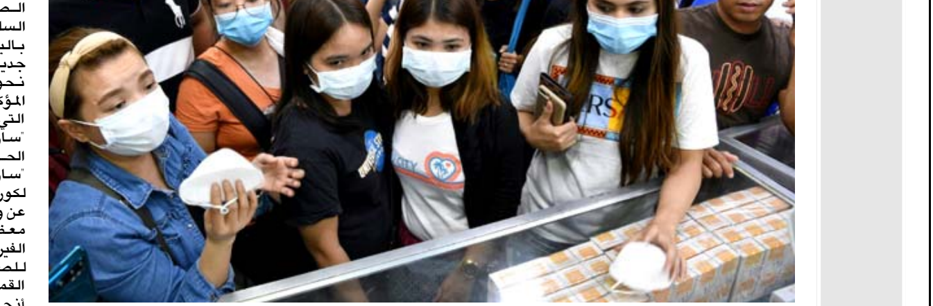
أقنعة: نساء يشتري أقنعة واقية من متجر للمعدات الطبية في مانبلا

وقالت لكثني خضيت ان يؤثر ذلك على ولفغتي. وقال الحارس دو غوبيليانغ (47 عاماً) إنه سيعاود عمله في بكين اعتباراً من الأحد، بعدما عاد من مقاطعة لياونينغ (شمال شرق). وقال "الكثير من الزملاء (من هويباي) لا يمكنهم العودة، بتعين الآن على أي مسافرين اجانب من الصين. وارتفع عدد الدول التي أكدت وقوع إصابات على ترابها إلى 24 بعدما أكدت بريطانيا وروسيا والسويد أولى الإصابات لديها. وارتفع عدد الوفيات في الصين إلى 304 الأحد، إذ سجّلت السلطات 45 حالة وفاة جديدة مقارنة باليومان السابق. وتم تأكيد 2590 إصابة جديدة في الصين، ما يرفع المجموع إلى 14500 حالة. ويعد عدد الإصابات المؤكدة في الصين أعلى بكثير من تلك التي تم تسجيلها عندما انتشر فيروس "سارس" (متلازمة التهاب تنفسي الحاد) عامي 2002، 2003. واستفّر "سارس" الذي تسبب به فيروس شبيه لكورونا المستجد وبدأ أيضاً في الصين على وفاة 774 شخصاً حول العالم معظمهم في الصين وهونغ كونغ. وظهر الفيروس في أسوا توقيت ممكن بالنسبة للصين، فترامن مع عطلة رأس السنة القمرية عندما يسافر مئات الملايين في أنحاء البلاد على متن طائرات وقطارات وحافلات لسقضاء الموسم مع