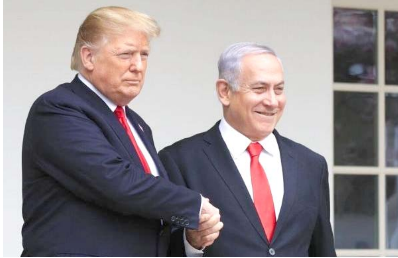
مصافحة : الرئيس الأمريكي يصافح رئيس الحكومة الاسرائيلية

الخطة الذي يقضي إلى استعمار نحو خمسين مليار دولار في الأراضي الفلسطينية والدول العربية المجاورة على مدى عشر سنوات. ويقول الفلسطينيون إن الخطة تقضي بان تضم اسرائيل غور الأردن المنطقه الاستراتيجية الواسعة في الضفة الغربية والمستوطنات في الأراضي الفلسطينية والإعتراف بالقدس عاصمة موحدة للدولة العبرية لكن الغموض يلف مسألة قيام دولة فلسطينية. وقد رفض ترامب وكوشنر حتى الآن استخدام هذه العبارة، في قطعية مع الموقف التقليدي للأسرة الدولية تلذي يؤيد حل الدولتين.