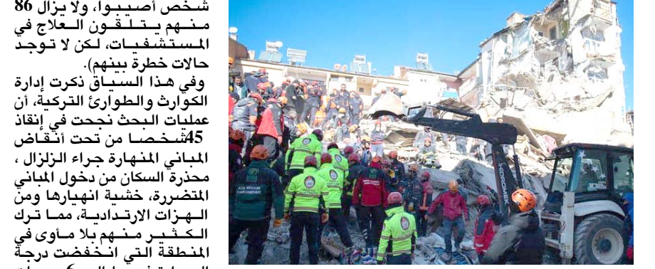
زلزال: فرق الانقاذ تتابع البحث عن ناجين في زلزال تركيا

بغداد - الزمان توقعت الهيئة العامة للأنواء الجوية والرصد الزلزالي التابعة لوزارة النقل أن يكون طقس اليوم الأربعاء غائماً مصحوباً بأمطار متفرقة في بعض الأمان. وقالت الهيئة في بيان امس ان (طقس اليوم الأربعاء في المنطقتين الوسطى والشمالية غائم مصحوب بامطار وتلوج في الاقسام الجبلية حيث تنخفض درجات الحرارة قليلا عن اليوم السابق)، وأضاف اما (طقس المنطقة الجنوبية سيكون غائماً ودرجات الحرارة ترتفع قليلا