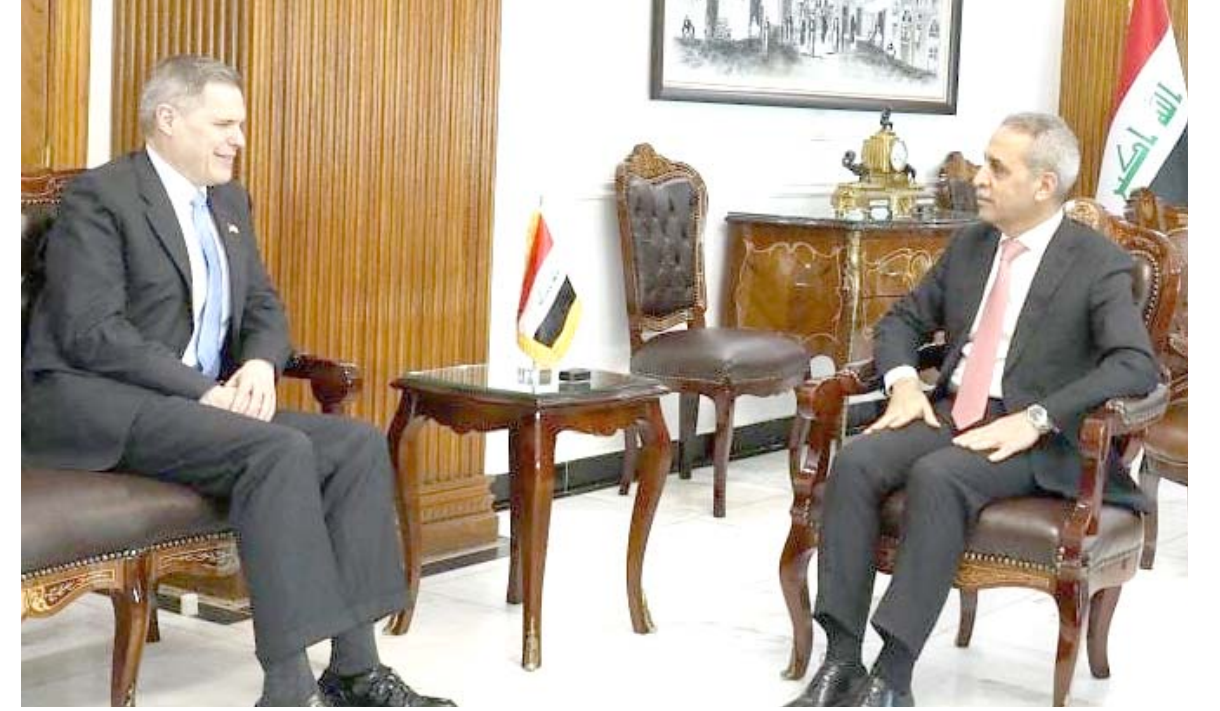
لقاء: رئيس مجلس القضاء الاعلى يلتقي السفير الامريكى في بغداد

وعلى لجنة لتضييف رئيس الجمهورية وبيان اسباب عدم تكليفه مرشحاً لرئاسة الوزراء وقال العطافي في