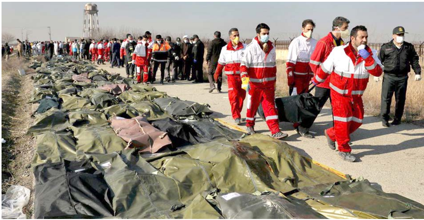
طائرة: جثث ركاب الطائرة الاكرانية المتكوية على الارض

الماليزية في رحلة بين امستردام وكوالالمبور وعلى متنها 298 شخصاً بينهم 196هولندياً، قرب منطقة دويتشك في شرق أوكرانيا الذي يشهد نزاعاً مسلحاً وسيطر عليه الانفصاليون الموالون لروسيا، بدون أن يتنجو أحد من الحادث.توصل المحققون الدوليون في ايار/مايو 2018إلى أن الطائرة اسقطت بصاروخ بوك السوفياتي المنطلق من اللواء 53 الروسي للدفاع الجوي في كورسك، في جنوب غرب روسيا في حيزران/يونيو 2019اتهم المحققون ثلاثة روس وأوكرانيا في هذه القضية، من المقرر أن تبدأ محاكمتهم في آذار/مارس 2020 في هولندا. ويتوقع أن تجري محاكمتهم غيابياً - 23 آذار/مارس 2007:سقوط طائرة من نوع اليوشين تابعة للخطوط البيلاروسية بصاروخ بعيد إقلاعها فوق العاصمة الصومالية مقديشو التي كانت تشهد حرباً أهلية، ما أسفر عن مقتل 1 شخصاً، وكانت الطائرة تقل فريق مهندسين وتقنيين بيلاروسيين توجهوا للصلصال لإصلاح طائرة ضربت بصاروخ قبل اسبوعين- 04 تشرين الأول/أكتوبر 2004:انفجار طائرة توبوليف نو 54 تابعة لشركة سيبير الروسية التي تربط بين تل أبيب ونوفوسيبيرسك في سبيريا الغربية، في السماء أثناء تحطم طائرة بوينغ 737 التابعة لخطوط الجوية الأوكرانية قبل ثلاثة أيام فوق طهران- 17 تموز/يوليو 2014:سقوط طائرة بوينغ 777التابعة للخطوط الكازرة. وبعد اسبوع، أعلنت كيف