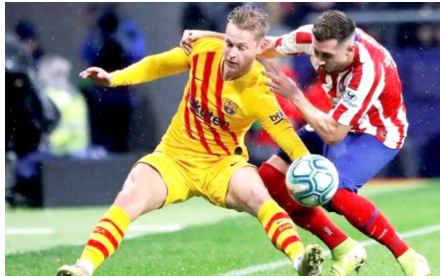
لقطة لمباراة برشلونة أمام أتلتيكو مدريد

أيام قليلة تفصلنا عن انطلاق بطولة السوبر الإسباني بنظامها الجديد، والتي ستقام على الأراضي السعودية خلال الفترة من 8 إلى 12 يناير / كانون ثان الجاري، بالمشاركة مع برشلونة وريال مدريد وأتلتيكو وفالنسيا. ومن المقرر، أن يلتقي ريال مدريد في نصف النهائي مع فالنسيا، الأربعاء، المقبل، على ملعب الملك عبد الله الرياضية (الجوهرة المشعة). بينما يجتمع نصف النهائي الآخر بين برشلونة وأتلتيكو مدريد، وسيقام اللقاء، في ملعب فيسنتي كالدرون، معقل أحرزه خوسيه رامون أليكانزا، ليحصد تاريخ مخيف ويهيأ عن نسخة 1985 فإن أتلتيكو مدريد اصطدم ببرشلونة في السوبر الإسباني خلال 4 مناسبات أخرى، لكن نجح البارسا في حسم جميع هذه المواجهات لصالحه والفوز باللقب. وبشكل إجمالي في السوبر الإسباني، فإن أتلتيكو واجه برشلونة في 10 مباريات، حيث نجح الوريخيلاكتوس في الفوز مرتين فقط، بينما تفوق البارسا 5 مرات، وسيطر التعادل على 3 مواجهات. وأحرز أتلتيكو مدريد في شباك برشلونة بأحسن أداء في السوبر الإسباني 12 هدفاً، بينما استقبلت الشباك المرديية 16 هدفاً.