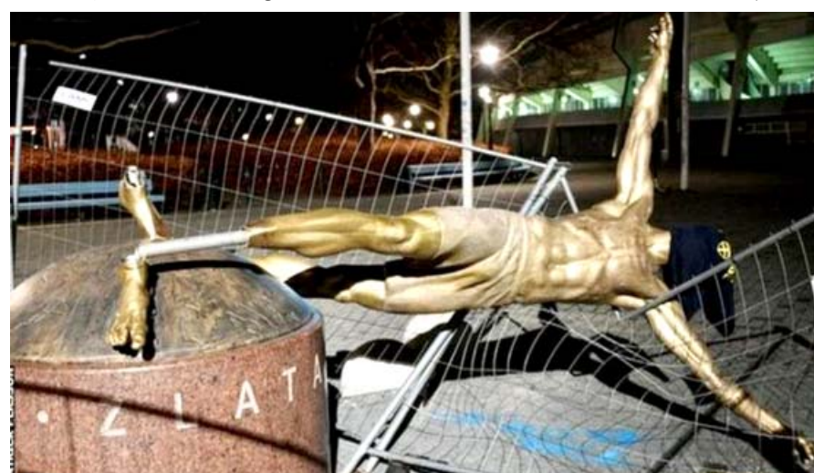
جانب من تهديم تمثال النجم إبراهيموفيتش

اسقط مخربون تمثالاً أقيم لنجم كرة القدم السويدي، زلاتان وكان التمثال الموجود خارج ملعب إبراهيموفيتش، في مدينة مالو، بقطعته من رسغ القدم.