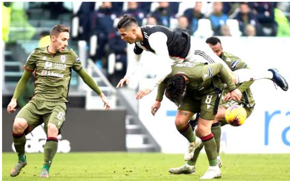
فوز: حقق فريق يوفنتوس فوزاً عريضاً في الدوري الإيطالي

في الدقيقة 88. وسدد جواو بيدرو في الدقيقة الثانية من الوقت بدل الضائع، كرة من داخل منطقة الجزاء اصطدمت بالعارضة، ليتنتهي اللقاء بفوز يوفنتوس برعاية نظيفة.