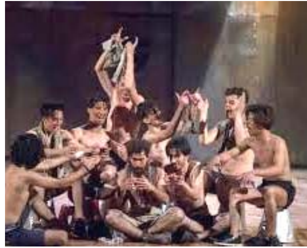
مشاهد من (تقاسيم الحياة)