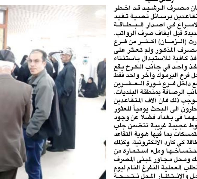
متقاعدون يزدحمون على شبابيك استبدال بطاقة ماستر كارد