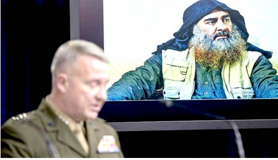
عرض، صورة على شاشة عرض قائد القيادة الوسطى الأمريكية مارين جنرال

الخبير بالتحليل والتناحر والتباهي في التعاطي معها بسبب تعدد أشكالها الجميلة من "أكسوراتها" المرئية، بل أضحت هذه الأداة لدى البعض نوعاً من الترف الذي يضاهي استخدام الشيشة المقرف في أماكن عامة وجلسات السمر والسهرات الليلية في النوادي والبارات ومخارج اللهو، وحتى في المنازل. بل هناك من يتخترع بنفث دخان السجائر الإلكترونية إلى أبعد مسافة ممكنة، في إشارة إلى مناعته والسباحة في مخلطه الحالة ناسياً أو متناسياً أن ما يستنشقه من سموها الإلكترونية يجعل الكثيرون كنهها وتركيبتها ونوع مادتها، صحيح أن رائحة التبوغ المستخدمة في السجائر التقليدية مقارنة مع نظيرتها الإلكترونية تكاد لا تُطَاق، وخاصة حين التقرب أكثر من المدمنين عليها والاختلاط بهم بسبب ما تنشره هذه السمو من روائح كريهة وما تتركه من آثار على وجه المخن ويشكل الشاربين المصفرين حد الاحتراق. لكن في المقابل، لا يبدو للنظر السوي أن ما يفتحه ويستخرجه المدمن على الأداة الجديدة من دخان أبيض كالتلج وما يستنشقه عبر منخاريه من بخار الملحوظ الإلكتروني الذي يحتوي على مواد مثل النيكوتين والجريسرول والبروبيلين غليكول ونكهات وما شاكلها من مواد مضافة ومن ملوثات ومسرطنات، هو في حقيقته غير صحي تماماً وغير مقبول ولا مستساغ من حيث المنظر وشكل الاستخدام وسط العامة. ولعل منع التدخين باتشاكلها في دوائر عامة ومطارات ومواقع يدخل ضمن هذا المفهوم بكون عادة التدخين غير مقبولة وغير مستحبة أساساً، سعياً بالتالي وراء خلق بيئة صحية مناسبة ومقبولة للجميع، فالأماكن العامة ومنها المخلقة تحديداً، وتصبح ملقاً للمدمنين على أشكال التبوغ وأدوات التدخين، حتى لو كانت بتقنية جديدة تدعى الحفاظ على صلة البشر وبيئة الطبيعة التي ازداد تولؤها بسوء استخدامها.