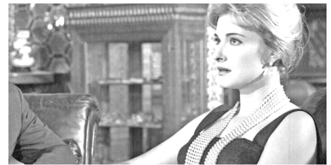
مريم فخر الدين

القاهرة - الزمان من بين النجوم التي استطاعت أن تحفر اسمها بحروف من ذهب في السينما المصرية وقلوب جمهورها في الوطن العربي هي الممثلة الراحلة مريم فخر الدين، فهي الفتاة الرومانسية التي كانت تمر أمام الشاشة كالحمامة الوردية حتى نالت القاب تعبر عن هدونها على الشاشة كهدهود ملاسحها ومن القابها: ملاك السينما الطاهر، برنيسية الأحلام، حسنة الشاشة. وفي السطور التالية نتوقف عند بعض محطات حياتها وفق تقرير أعدته موقع البوابة، الذي يشير إلى أن (اسمها الحقيقي مريم محمد فخر الدين من مواليد الفيوم وكان والدها يعمل مهندساً للري، أما والدتها بابولا فهي مجرية الأصل تعرف عليها أبوها وتزوجها أثناء سفره بالخارج. ولها شقيق واحد هو الممثل يوسف فخر