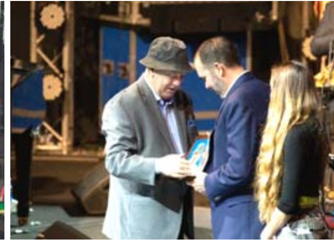
إبداع متواصل: فعاليات متعددة تضمنها حفل احتفاء إلهام المدفعي بمرور 55 عاماً على مسيرته الفنية