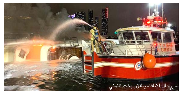
رجال الإطفاء يطفون بيت أنتوني

□ نيويورك - وكالات - تعرض المغني الأمريكي مارك أنتوني لحادثة مفجعة ، بعد أن اشتعلت النيران في بيته البالغ قيمته 7 ملايين دولار، قبل انقلابه في ميناء ميامي مؤخرًا، ونشرت فرق إنقاذ مدينة ميامي عبر صفحاتها الخاصة على أحد مواقع التواصل الاجتماعي مقطع فيديو للحريق، وذلك بعد إستجابتهم للنداء وتوجههم لإطفائه، وإشراق موقع رسمي في تقرير له إلى