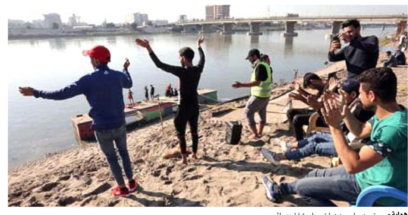
بغداد - (أ ف ب): تشهد ضفة أطلق عليها (شاطيء التحرير) تمتد لنحو نصف كيلومتر على نهر دجلة على مقربة من ساحة التحرير في قلب بغداد، نشاطات فنية ورياضية وترفيهية ينظمها شباب حقبة ما بعد نظام صدام حسين.

بغداد - الزمان قالت نائب الممثل الخاص للامم العام للأمم المتحدة في العراق اليس ولولبول أن مهمة مجلس المفوضين الجديد صعبة ومعقدة صعبة عن امها أن تسهم فرقة اختيار الأعضاء بتعزيز نزاهة العملية وزيادة ثقة الجمهور . وأكدت ولولبول - (الزمان)