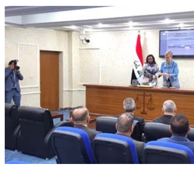
قرعة : نائب ممثل الامم العام في العراق خلال قرعة اختيار أعضاء المفوضية

بغداد - الزمان قالت نائب الممثل الخاص للامم العام للأمم المتحدة في العراق اليس ولولبول أن مهمة مجلس المفوضين الجديد صعبة ومعقدة صعبة عن امها أن تسهم فرقة اختيار الأعضاء بتعزيز نزاهة العملية وزيادة ثقة الجمهور . وأكدت ولولبول - (الزمان)