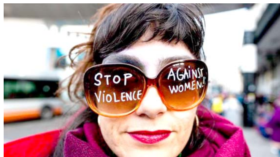
بحث : 38 في المئة من المشاركات في البحث اكدن تعرضهن لممارسات عنيفة