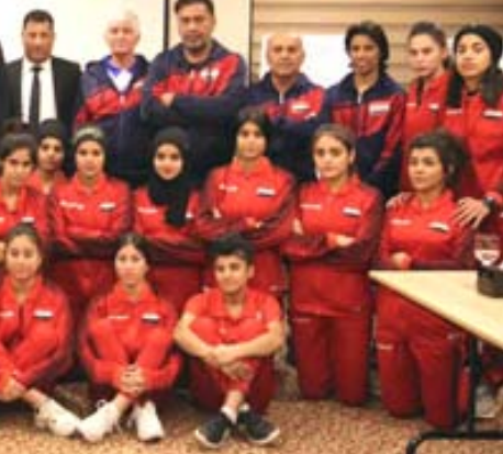
مشاركة: منتخب شباب العراق يشارك في بطولة آسيا بالبحرين