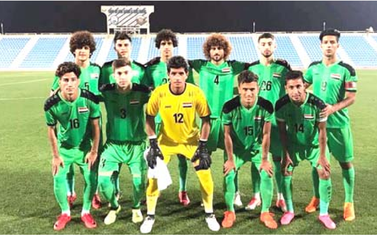
معسكر: يواصل المنتخب الأولبي معسكره التدريبي في الإمارات استعداداً لنهائيات آسيا

عليها اللعب وللأسف زالت بعدة من طموحات الفرق التي تامل بان تذهب لجنة المسابقات الى ما تريده الفرق كطريقة بديلة للدوري والاتفاق مع الفرق الى آلية تقبل بها لأنها هي صاحبة المصلحة في الدوري إمام ما قامت به من تهيئة وإعداد وصرف مبالغ عالية وتعاقف مع لاعبين محترفين الى آخر الأمور ما دفع الأندية للضغط على الإتحاد في يستجيب لها عبر تحقيق الحوار الذي يخدم كل الأطراف.