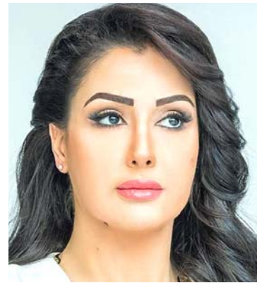
غادة عبد الرزاق

الرباط - الزمان كشفت المطربة المغربية سميرة سعيد عن موعد طرح كليب أغنيها الجديدة (هليلة)، وهو نهاية الشهر الجاري ونشرت صورة الإعلان الدعائي لها على حسابها الخاص على أحد مواقع التواصل الاجتماعي، وعلقت قائلة ( أن شهر كانون اول من العام الجاري هو موعد كليب أغنيتي الجديدة ) على سعيد آخر أكدت سعيد أنها ليست طبخة ماهرة، مشيرة إلى (أنها كانت تتواصل مع والدتها لتتقدم بتحضير بعض الوصفات). وأشارت إلى (أنها تزوجت ووجدت نفسها لا تعرف شيئاً عن الطبخ).