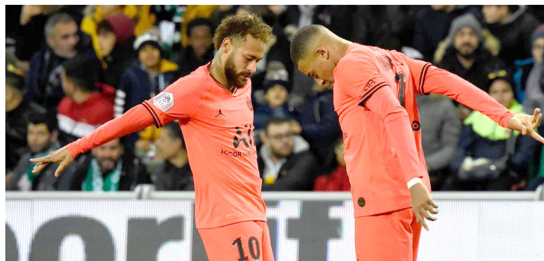
فوز: حقق سان جيرمان فوزاً كبيراً على سان إيتيان في الدوري الفرنسي

من على مقاعد البدلاء. إلا أن دينيس بوانجا، بقي محور الخطورة الوحيد لأصحاب الأرض، حيث هدد رمي كيلور ناساف بفرصتين. أما روفيه، فواصل التصدي وحده للطفوفان الهجومي الباريسي، مبابي ودي ماريا وإيكاردي ومباريديس. وأضاح ندمار فرصة ممتدة للتعزين، حيث سد ركلة جزاء في القائم الأيسر. وتحرك مدرب سان جيرمان، توماس توخيل، لتنشيط الصفوف، حيث اشرك ماركو فيراتي وليفين كورزاوا مكان تياجو سيلفا وخوان بيرنات، ووسط سيطرة باريسية تامة، لعب كورزاوا كرة عرضية من الجهة اليسرى، أكملها إيكاردي بسهولة في الشباك، مسجلاً الهدف الثالث لفريقه. وفي الدقائق الأخيرة، شارك المدافع الألماني تيلو كيرير مكان مونيه، وسط محاولات بانسة أصحاب الأرض من أجل تقليص الفارق، بينما غاب كيليان مبابي التسرع، سدها بقوة في الزاوية اليمنى، لتنتهي المباراة بفوز كاسخ للفريق الباريسي.