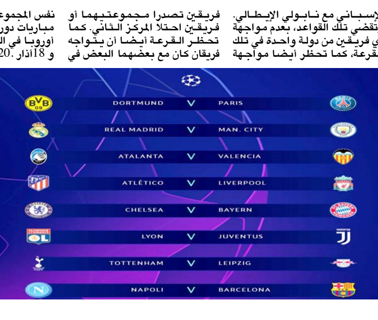
قرعة ثمن النهائي دوري أبطال تضع برشلونة في مواجهة سلة

فريقين تصدرا مجموعتهما أو فريقين احتلا المركز الثاني، كما تحظر القرعة أيضاً أن يواجه فريقان كان مع بعضهما البعض في