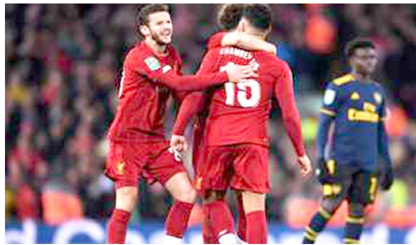
مدرب ليفربول يستعين بالشباب أمام أستون فيلا

للليفربول، لوح في وقت سابق بالانسحاب من بطولة كأس الرابطة، نظراً لتزامن منافسات دور الثمانية بها مع مونديال الأندية لكرة القدم، وذلك ضمن الجدول المزمع للفريق خلال كانون أول، لكن تقدر بعدها خوض المونديال بالفريق الأول والدفع بفريق من الشبان في بطولة