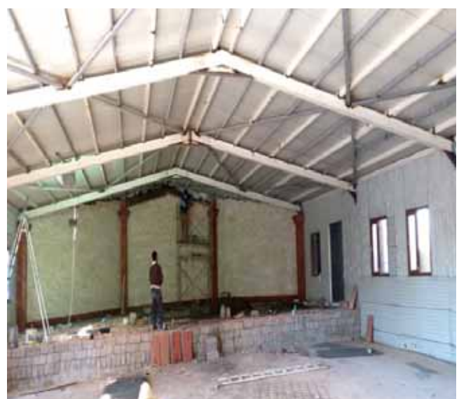
كنيسة: جانب من كنيسة سيدة البشارة