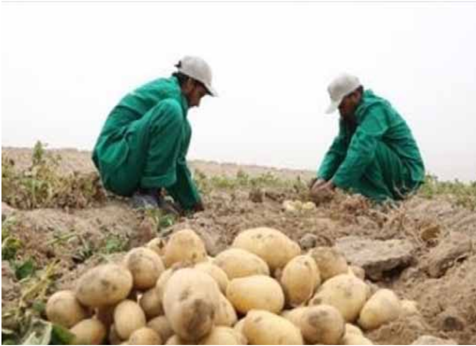
موسم: مزارعان يحصدان ناتج الارض في الموسم الزراعي

للتصدير تصل إلى 10 جنيهات، بينما يصل سعره حالياً في السوق إلى نحو 5 جنيهات. ويكشف محمد عبد الحفيظ مسؤول في إحدى شركات التصدير، أنه (خلال السنوات الماضية تراجعت الكميات المصدرة من الرمان المصري إلى أوروبا، بسبب وجود بقايا من المبيدات أعلى أبوتيج، إذ أدى انقطاع الكهرياء إلى فساد الرمان داخل الشالجات، وقُدرت الخسائر وقتها بنحو 15 مليون جنيه. ?ويوضح أنه (في حال عدم وجود أسواق للتصدير، يضطر المصدّر إلى البيع في السوق المحلي، ولكن إن كانت تكلفة كيلو الوارد المعد