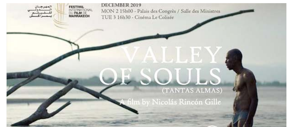
المسوق الترويجي لفيلم (وادي الأرواح)

مراكش - الزمان من خلال عيون الصياد الكولومبي خوسيه، يرسم المخرج نيكولاس رينكون صورة قائمة للحياة في إقليم بوليفار في أوائل الألفية عندما كان الإقتال الداخلي بين سكان المنطقة والميليشيات الكولومبية على