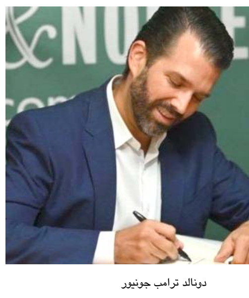
دونالد ترامب جونيور

وفي تغريدة على تويتر، رد عضو الكونغرس الديمقراطي، روبن غاليجو، الذي حارب في العراق، على ترامب جونيور بالقول: "رجال ممن خدمت معهم، مدفونون في القسم 60م مقبرة أرلينغتون". أزوهم شهرياً، لو قدر لترامب جونيور العيش لآلاف عام فلن يقترن أبداً من أن يكون جيداً ونزيهاً كما كانوا. من جانبه كتب المؤلف والنقيب من صنوبر الكتاب رسمياً، وبعد يوم واحد من صدور حكم بتغريم الرئيس ترامب مليوني دولار، بسبب استخدامه أموالاً