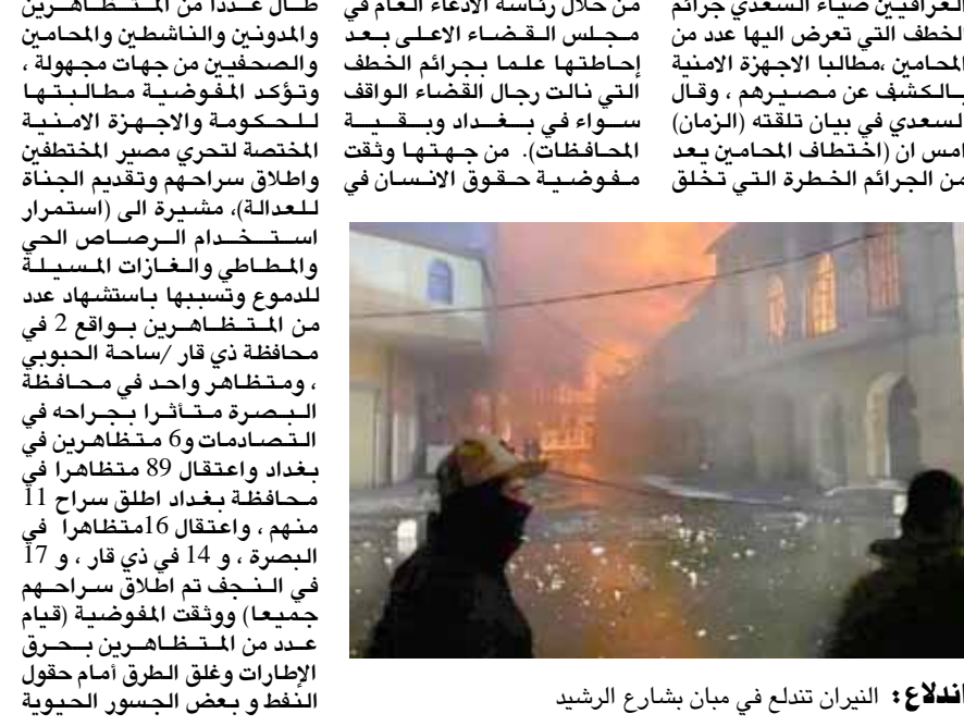
اندلاع : النيران تتدلج في مبان بشارع الرشيد

بغداد - فائز جواد أجواء من الرعب والتخويف بين صفوف المحامين المتظاهرين المسلمين وتؤدي ايضا الى هز المجتمع العراقي، مطالباً (الاجهزة الامنية ذات العلاقة الرصدية في متابعة ساحات التظاهر في بغداد والمحافظات اشترت فرق المفوضية ارتفاع حالات الخطف والاعتقال التي طال عددا من المتظاهرين والمدونين والناشطين والمحامين والصحفيين من جهات مجهولة، وتؤكد المفوضية مطالبيتها للحكومة والجهزة الامنية المختصة لتجري مصير المحتظفين واطلاق سراحهم وتقديم الجناة للعدالة)، مشيرة الى (استمرار استخدام الرصاص الحي والمطاطي والغازات المسيلة للدموع وتسببها باستشهاد عدد من المتظاهرين بواقف 2 في محافظة ذي قار / ساحة الحيوي ، ومتظاهرين واحد في محافظة البصرة متخافين بجراحه في التصادمات مع متظاهرين في بغداد واعتقال 89 متظاهرا في محافظة بغداد اطلق سراح 11 منهم ، واعتقال 6 متظاهرا في البصرة ، و 14 في ذي قار ، و 17 جميعا) ووثقت المفوضية (قيام عدد من المتظاهرين بحرق الطارات وعلق الطرق امام حقول النفط وبعض الجسور الحدودية