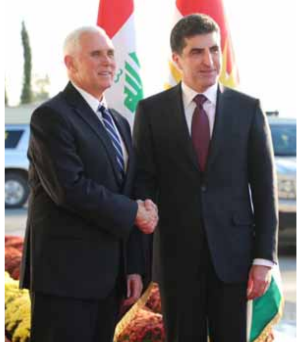
مصافحة : رئيس إقليم كردستان يصافح نائب الرئيس الأمريكي

موجودين في قواعد عسكرية في العراق، في إطار التحالف الدولي ضد تنظيم داعش الذي تقوده واشنطن، كما جعل هؤلاء في محال التدريب وتقديم الاستشارة للقوات العراقية. وفي وقت لاحق من يوم امس وصل رئيس إقليم كردستان نجيبرفان بنس الى أربيل قادماً من بغداد وكان يرافقه مسعود البارزاني ونائبه قويدا الطالماني في استقبال بنس بمطار أربيل الدولي، بحسب مصدر اجتمعوا مع بنس فور وصوله.