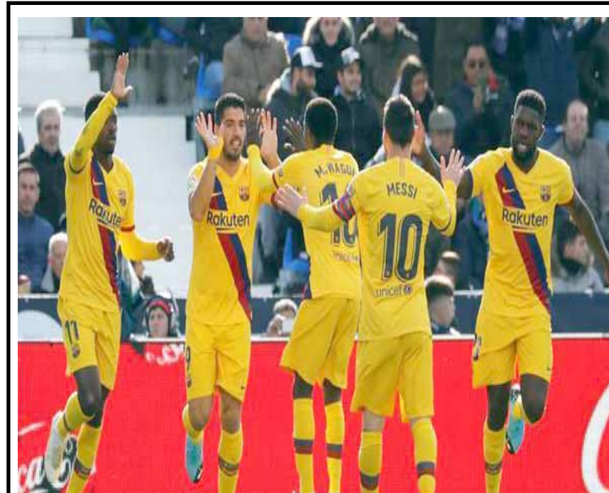
برشلونة تنفذ كبرياءها أمام ليجانيس بثنائية في الليغا

أكد مكتب رئيس الوزراء عادل عبد المهدي أمس أن زيارة نائب الرئيس الأمريكي مايك بنس إلى العراق متفق عليها وجاءت لتفقد قوات بلاده في قاعدة عين الأسد، مشيراً إلى حصول اتصال هاتفي بين الجانبين، فيما غادر بنس بغداد متوجهاً إلى أربيل للالتقاء برئيس الإقليم والحكومة. وقال المكتب في بيان إن بنس ( قام بزيارة متفق عليها إلى العراق تفقد خلالها قوات بلاده في قاعدة عين الأسد العراقية في إطار التحالف الدولي الذي يقوم بدعم القوات العراقية في محاربة داعش ومن المتفق هاتفي أمس السبت بجري زيارة أربيل أيضاً) وأوضح أنه سيجري اتصالاً هاتفي أمس السبت بحضور الساعة الثامنة عشرة والنصف ظهراً بين عبد المهدي ونائب الرئيس الأمريكي تناولت تعزيز العلاقات بين البلدين وفاق التعاون المشترك، إلى جانب بحث التطورات التي يشهدها العراق وجهود الحكومة وإجراءها مع المتظاهرين، وبحسب مطالب بنس ( نصيب الرئيس الأمريكي دونالد ترامب)، مؤكداً استمرار التعاون من أجل تطوير العلاقات المتعددة بين البلدين، وأضاف البيان أن رئيس مجلس الوزراء يأخذ بنس نائب الرئيس وعائلته بعدد الشكر، وطالب نقل حصياته إلى الرئيس الأمريكي والقوات التي تساهم بتدريب القوات العراقية، وأكد أهمية سيادة واستقلال العراق وعلى توفير الأمن والاستقرار للبلاد وحماية مصالح جميع العراقيين بمختلف مكوناتها وبيئاتهم وحصر السلاح بيد الدولة وتعاون البلدين في إطار الاتفاقيات الاستراتيجية المتعددة بينهما) وتحدثت وسائل إعلام أجنبية أمس عن وصول بنس إلى