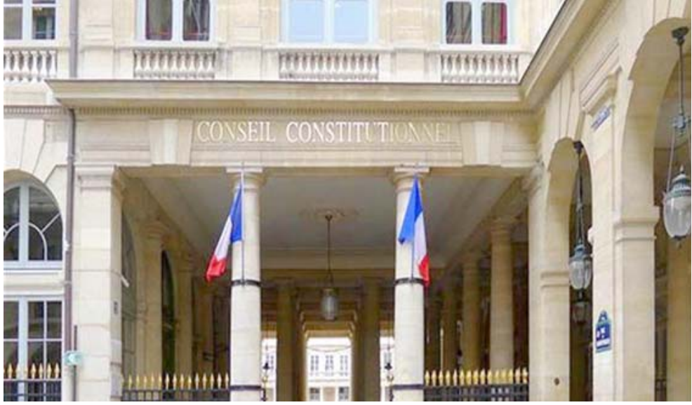
محكمة فرنسية تحكم بسجن امرأة غادرت إلى سوريا

لي ومتعلقة بعمله في ال سي أي ابنة. وتتضمن هذه المكرات من بين أشياء أخرى معلومات استخباراتية واسماء حقيقة لعلاء واماكن لقاءات متعلقة بعمليات أمنية وارقام هواتف وحسابه المحمول تصف أين تكلف وأقابت وزارة العدل. وقال جاون براون مساعد مدير مكتب التحقيقات الفدرالية لمكافحة التجسس إن هناك "تداعيات خطيرة" لما أقدم عليه لي.