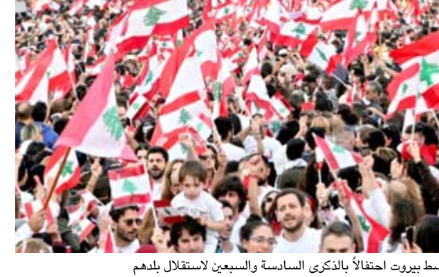
استقلال؛ متظاهرون يرفعون الاعلام اللبنانية في ساحة الشهداء وسط بيروت احتفالاً بالذكرى السادسة والسبعين لاستقلال بلدهم

واضفت "أمل ان يشكل يوم الاستقلال في العام 2019 تحولا في حياة اللبنانيين، وليست هذه المرة الأولى التي يتظاهر فيها اللبنانيون بحماس، ففي العام 2005 شهد وسط بيروت تظاهرات شارك فيها مئات الألوف اعقت اغتيال رئيس الحكومة الأسبق رفيق الحريري وادت إلى خروج القوات السورية من لبنان، لكنها جاءت تجاوبا مع نداءات أحرار ليبيا، وضعت العلم اللبناني حول عتقها لقناة المؤسسة اللبنانية للإرسال "حنا هذا المرة تصنع وطناً بشعبنا". وقالت سيدة أخرى "نحن مغتربون في الخارج لكن قلوبنا مع أبناء بلدنا، حننا لندهمهم ونقول لهم: لستم لوحكم".