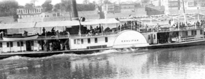
زودق في نهر دجلة

وكان الرحلة الأمريكي وليم فوك قد زار المستشفى عام 1874 فوصفها بقوله (وهي بناية واسعة ولطيفة، وهناك من التعارف بيني وبين الجراح المقيم، فدار بي في الزمعات ، حيث بلقى العناية مائة وثمانون مريضاً، كلهم جنود، وعلى درجات مختلفة من السقاهاة. وقد لاحظت ان سقوط الغرف عالية، والتهوية فيها جيدة، والملابس نظيفة. وكانت جميع الترتيبات فيه مماثلة لأي مستشفى أوربي من نوعه. كما شاهدت الصيدلية والحمامات . ثم اتخذت إلى مكتب الرئيس، قدمت لي القهوة والسكاير والشريد . وكان الطبيب الجراح يقطن الفرنسية جيداً، وقد