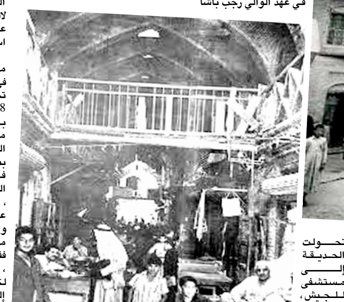
سوق الخفانيش الجاور والموازي لسوق الشراي

من جانب آخر اتخذت الورشة تقدم خدماتها للقطاع العسكري. إذ صارت تقوم بصيانة التبايق القديمة المسماة (جاقما قلي قوال فثلك) وتعيد لها الحياة بحيث تكون قابلة للاستخدام من جديد . فالبنادق التي استخدمها الجيش واستبدلها ببنادق حديثة (شميشخان)، كانت القديمة