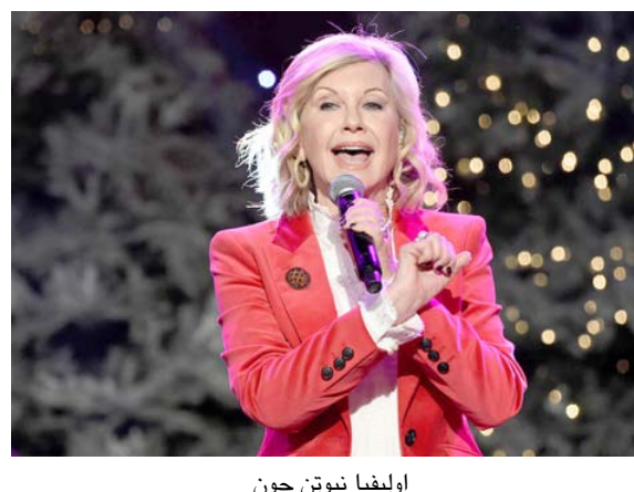
أوليفيا نيوتون جون

خلال مزاد أقيم في بيرفلي هيلز يوم السبت وهو ما يزيد مرتين عن السعر المتوقع. ومثلت هذه الملابس تحول شخصية نيوتون-جون في الفيلم الموسيقي الذي عرض بيعة بمبلغ 405700 دولار