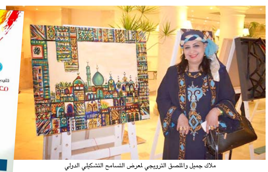
ملاك جميل والمصنق الترويجي معرض التسامح التشكيلي الدولي

التلقته (الزمان) امس (أن) المعرض يشارك فيه أكثر من مائة فنان وفنانة من داخل وخارج العراق ومن عراقيين مقيمين في كندا ويحتوي على أعمال مختلفة في الرسم والنحت والخزف فضلاً عن أعمال فوتوغرافية تعكس روح وحدة الإنسانية التي نبع من طين النهرين العظيمين دجلة الفرات وعراق الرافدين، حيث تأسست أولى الحضارات الإنسانية التي علمت البشرية اجديلة العلم والنور والمعرفة، وكانت سومر وبابل وأشور واكد وكش والحضر وميسان وأشونة وغيرها، أيقونات حضارية تجذرت عطااتها في سفر