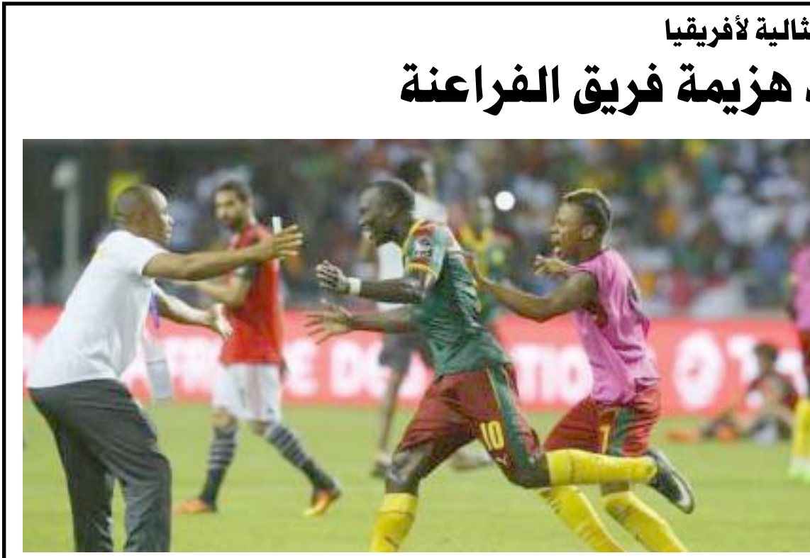
فرحة : لاعبو الكاميرون يتبادلون الفرحة بانتصارهم الكروي على مصر

العاج حاملة اللقب من الدور الأول وكان فوز الكاميرون بكرات الترجيح على السنغال في دور الثمانية أكبر مفاجأة. وقال المدرب هوجو بروس عقب الفوز على مصر يوم الأحد كان طموحنا احتلال المركز الأول أو الثاني في المجموعة والصعود لدور خروج المهزوم وانظرام هم سنسفر عنه الأمور وقتها. على مدار البطولة تحولنا من مجرد تشكيلة إلى أسرة واحدة. وأضاف صمو بوركيئا فاسو إلى الدور قبل النهائي والتي لم تكن ضمن الحسابات في البداية بعض الإثارة مثلما أثار تقدم منتخبنا مخفورة في بطولة الأهل العام الماضي المنع. وشهد التحكيم تحسنا كبيرا في دفعة معنوية أخرى لكرة القدم الإفريقية. وستحتفل الكاميرون البطلة الجديدة على عاتقها أمال كبيرة. وستستضيف النهائيات المقبلة في 2019 حيث سترغب