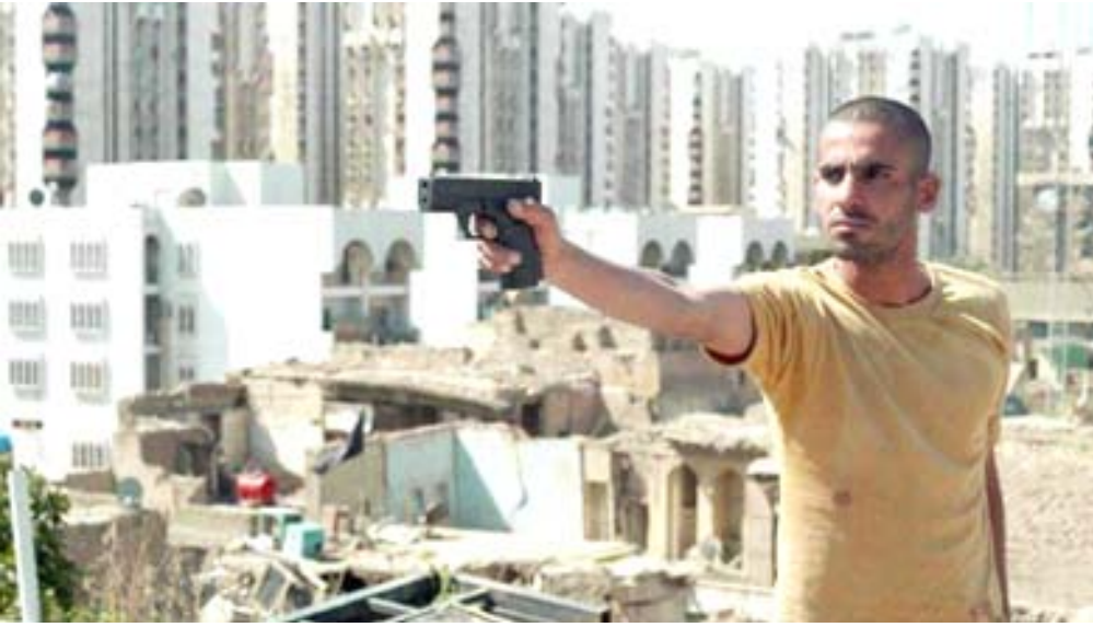
أفلام متميزة: فنانون في افتتاح مهرجان قرطاج السينمائي الذي يشارك فيه فيلم (شارع حيفا)