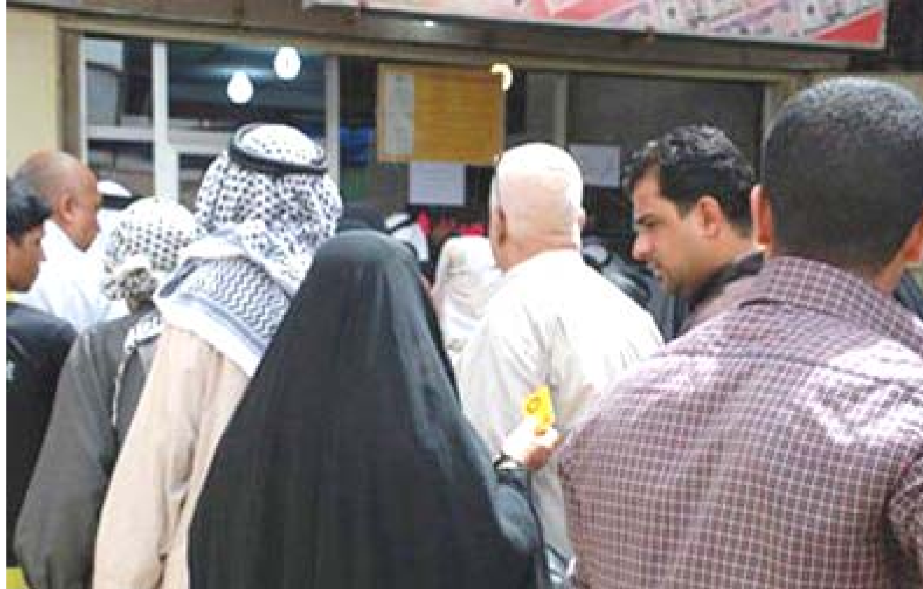
بغداد - الزمان

شهدت منافذ توزيع رواتب المتقاعدين، أمس، ازدحاماً غير مسبوق. وكانت الهيئة الوطنية للتقاعد قد أطلقت راتب شهر تشرين الثاني لجميع المتقاعدين، المدنيين والعسكريين، حملة بطاقات كي كارد.