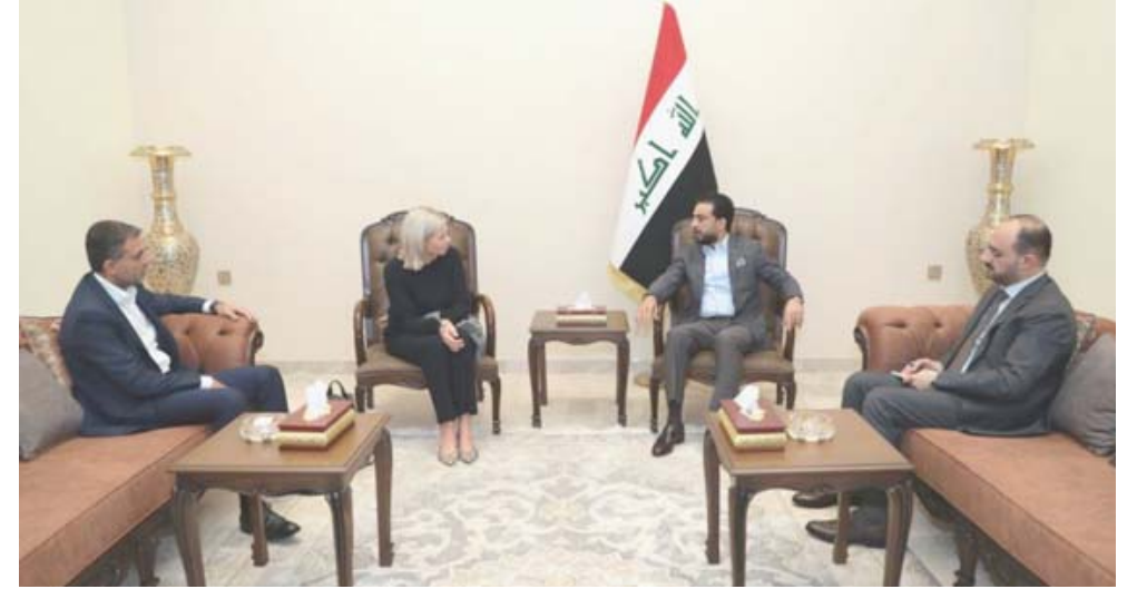
لقاء - ممثلة الامين العام للامم المتحدة خلال لقائنا رئيسي الجمهورية ومجلس النواب

التفنيذية لمحاكمة المفسدين الذين اضرأوا بالمال العام ومؤسسات الدولة، فضلا عن التعاون بين السلطتين التشريعية والقضائية في مجال مكافحة الفساد وتشريع القوانين اللازمة).