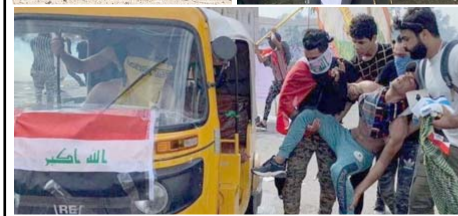
نقل: عجلات التكتك تنقل جرحى التظاهرات في ساحة التحرير