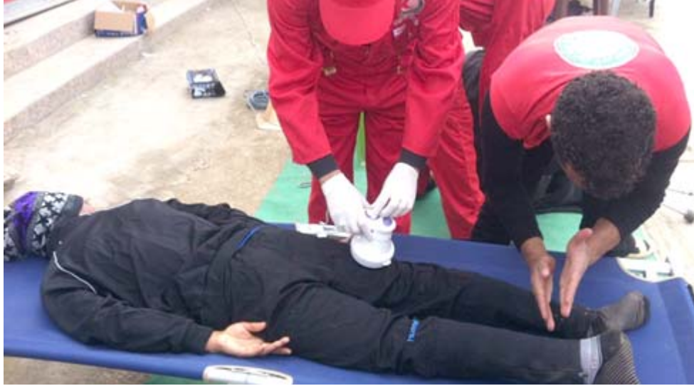
علاج مراكات الهلال الاحمر العراقية تقدم العلاجات الفورية للزائرين

المدينة وزايرها الذين اعربوا عن مدى ارتياحهم لمستوى الخدمات الطبية والصحية والعلاجية التي تم تقديمها لهم، وتركت أثرًا طيبًا في نفوسهم، وأضاف أنه (بالرغم من انتهاء خطة الطوارئ الخاصة بالزيارة، إلا أن مفارزنا الطبية مستمرة في تقديم خدماتها للزائرين).