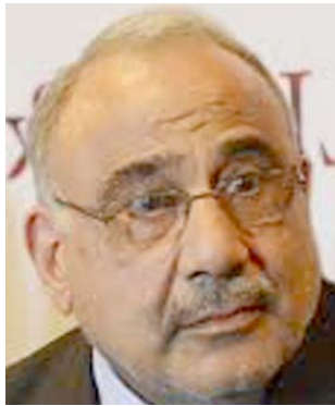
عادل عبد المهدي

بالأحداث التي راقت المتظاهرات. جلسة استثنائية وقال في بيان تلقته(الزمان) امس ان المجلس عقد جلسة استثنائية لمناقشة وتدارس الاحداث المؤسفة التي راقت المتظاهرات وحجم الضحايا والمصابين في صفوف المواطنين ومنسبتي القوات الامنية ، ومسير التحقيقات الاولية وتحديد الجهات المسببة والمرتطة بذلك ضيفاً ان(المجلس وجه بتشكيل لجنة تحقيقية برئاسة قيادة العمليات المشتركة وعضوية الجهات ذات العلاقة للتحقيق بحالات الاستهداف والاصابة في صفوف المتظاهرين ومنسبتي الاجهزة الامنية والاعتداءات على المنشآت والبنى التحتية ووسائل الاعلام ومحاسبة المعتبرين خلال مدة خمسة ايام اعتباراً من تاريخ 12 من الشهر الجاري كما قرر مجلس الأمن الوطني الاسراع باستكمال تشكيل قوة حفظ القانون) ، مشيراً ان (المجلس بحث موضوع ضبط وزارة الدفاع المسترربين من الخدمة والعمل على اعادتهم الى وحداتهم السابقة ، ووجه بان تتولى وزارة الدفاع التنسيق مع وزارة المالية لغرض إيجاد الحلول المناسبة لتأمين اربابهم).