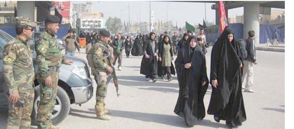
زيادة: قامون من المحافظات الى كربلاء للزيارة اربعينية

بغداد - عبد الطيف الموسوي عثرت الشرطة على جثة رجل مقتول طعنًا بالسكين في بغداد.وقال مصدر على تصريح امس، ان قوة امنية عثرت على جثة رجل مجهول الهوية مسعدة الاربدي في ساحة تراثية متروكة ضمن منطقة الامين الثانيةواضاف، ان (الجثة بدت عليها آثار طعنت سكين في بطنه، مبيناً انه تم نقلها الي اشارة الطب السعدي). دون مزيد من التفاصيل، واعلنت مديرية الاستخبارات العسكرية امس القبض على ايرهابي في المحمودية ببغداد ضمن خطة حماية الزائرين،وقالت في بيان انه (ضمن مساعيها لحماية زائري اربعينية الامام الحسين عليه