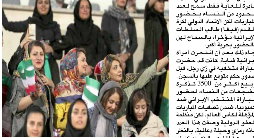
مشجعات إيرانيات يدخلن الملاعب للمرة الأولى

طهران - رزاق نامقي سمحت السلطات الإيرانية للنساء بنزاهة ملاعب كرة القدم للمرة الأولى منذ عقود. وشاهدت النساء الإيرانيات مباراة منتخبهن الوطني لكرة القدم للرجال في مواجهة كمبوديا الخميس وانتهت المباراة بفوز قماسي للفريق الإيراني، بنتيجة 14 هدفاً دون مقابل وكان يحضر على النساء في إيران حضور مباريات في ملاعب كرة القدم، منذ قيام الثورة الإسلامية عام 1979. وطالب رجال دين في إيران حين تكون النساء محميات من الأجواء الذكورية، ومشاهدة الرجال ملابس كرة القدم وفي حالات نادرة للغاية فقط، سمح لعدد محدود من النساء بحضور المباريات، لكن الاتحاد الدولي لكرة القدم (فيفا) طالب السلطات الإيرانية مؤخراً، بالسماح لهن بالحضور بحرية أكبر.