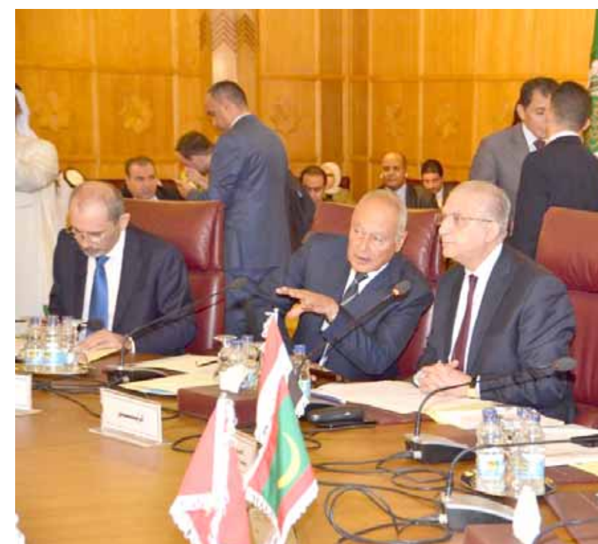
اجتماع: وزير الخارجية وأمين عام الجامعة العربية ووزير الخارجية الأردني في اجتماع امس

اجتماع: وزير الخارجية وأمين عام الجامعة العربية ووزير الخارجية الأردني في اجتماع امس استغلال الوضع في سوريا لتبرير ذلك الوضع الخطير وان تمنع احتلالها، محملاً ايها المسؤولون الكاملة عن (تجات عدوانها المسافر في سوريا)، ووجه مجلس الأمن الوطني خلال جلسة استثنائية له (بإتامين الحماية للحدود العراقية السورية من خلال قيادة قوات حرس الحدود والقطعات العسكرية للجيش العراقي والحشد الشعبي، مع استثناء قيادة قوات الحدود من تعليمات تنفيذ العقود الحكومية لغرض بناء الاسيجة المسلحة الأبراج ونصب الكاميرات الحرارية لتأمين الحدود العراقية السورية، وتخويل وكيل وزارة الهجرة والمهجرين الصلاحيات الادارية والمالية لبناء مخيم يحتوي سكان مخيم الهول السوري). وحذر زعيم الحزب الديمقراطي الاجتماعي في كردستان السيد مسعود البارزاني امس من ان استمرار المهادنة التركي على كردستان سوريا بشكل تهديداً جيداً لامن واستقرار المنطقة ودعا في رسالة موجهة الى الراي العام في كردستان الى الاسراع بمشيرا الى ان تركيا تحاول