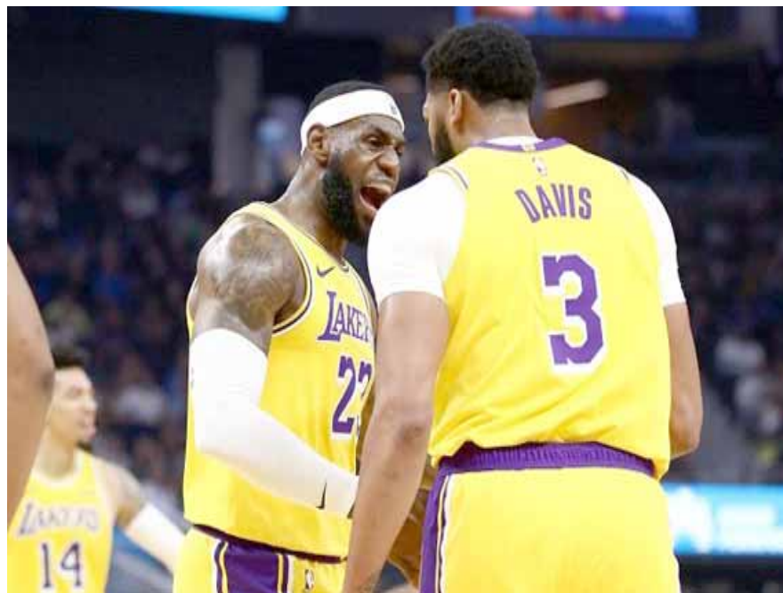
فوز مهم للليكرز في الدوري الاستعدادي لكرة السلة

مدن - وكالات حقق فريق لوس انجلوس ليكرز فوزاً كبيراً على مضيفه جولدن ستيت واريورز بنتيجة 123/101 ضمن منافسات الدوري الاستعدادي لكرة السلة الأمريكية NBA، وتمكن ليكرز من تحقيق الفوز مستفيداً من تالف الوافد الجديد أنتوني ديفيز الذي تالف في اللقاء وسجل 22 نقطة واستحوذ على 10 كرات مرتدة. وأضاف "الملك" ليليرن جيمس 15 نقطة ومرر 8 كرات حاسمة وأحرز جايفل مكي 10 نقاط وتابع 1.3 كرة مرتدة كما سجل دوايت هاورد 9 نقاط وعلى الجانب الآخر، كان النجم ستيفن كوري أبرز لاعبي الفريق الخامس بتسجيله 18 نقطة. وتعد هذه المباراة أول اختبار غير رسمي للليكرز في إطار مبارياته الاستعدادية واستطاع ليليرن ورفاقه التفوق على جولدن ستيت بنتيجة جيدة تدل على جاهزية الفريق.