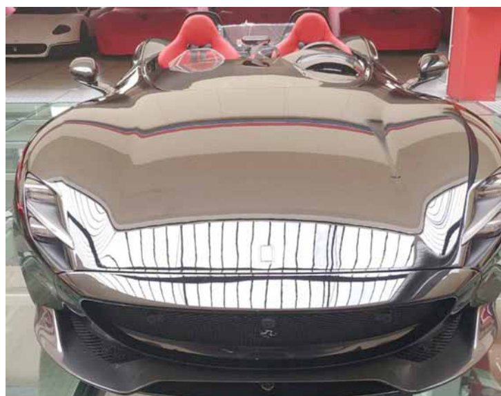
سيارة زلاتان الجديدة

مدن - وكالات الهدى النجم السويدي زلاتان إبراهيموفيتش، هداف لوس أنجلوس جالاكسي الأمريكي، نفسه سيارة من طراز فيراري "موزا" تصل قيمتها إلى 1.6 مليون يورو، احتفالاً بعيد ميلاده 38. على حسابه في موقع التواصل الاجتماعي "تويتر" كتب الهدف السويدي تغريدة قال فيها: "عيد ميلاد سعيد إلى زلاتان" وأرفق بها صورة السيارة الفيراري الجديدة التي ضمها إلى أسطوله. وأصبح زلاتان واحداً من 499 شخصاً فقط يمتلكون هذه السيارة الإيطالية على مستوى العالم. يعشق زلاتان تصديداً