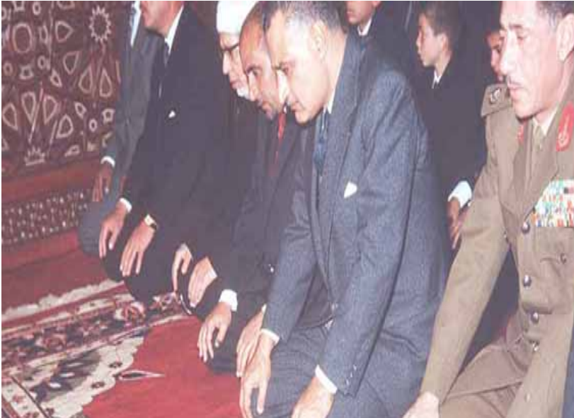
عبد الناصر يؤذي الصلاة

من هو عبدالحكيم عامر .. ولد عام 1919 بمدينة المنيا - مصر واكمل دراسته الولىية والشاوية بتفوق ، التحق بالكلية الحربية (العسكرية) وفي عام 1939 تخرج منها وعين ملازماً ثانياً وتخرج من كلية الزنكان 1948 واشترك في حرب فلسطين ضد الكيان الصهيوني ، واصل مع الرئيس عبدالناصر من الأعضاء الرئيسيين في حركة الضباط الاحرار ، اشترك في ثورة 23 تموز/يوليو 1952 وعمل مديرا