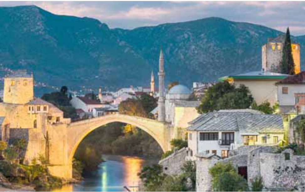
مسجد في بيئة يوغسلافية