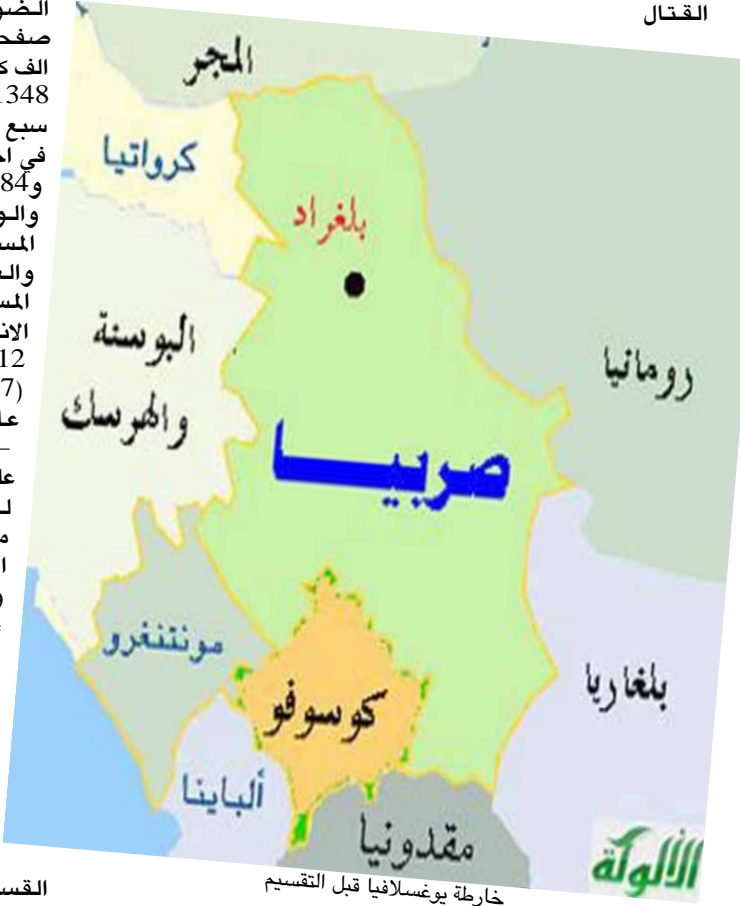
خارطة يوغسلافيا قبل التقسيم

مرت يوغسلافيا بمراحل تاريخية خلال القرن العشرين ، الاولى (مملكة صربيا) 1918-1914 حيث عانت هذه المملكة من صراع مستمر بين الكروات والسلوفان واصبح اسمها فيما بعد مملكة يوغسلافيا كمحاولة لدمج بقية الاقاليم وتوحيدها ، وبعد نهاية الحرب العالمية الاولى اعلى العرش الملك الكسندر الاول الحاكم المطلق للفترة -1929 1934 واوغتيل بعد هذا التاريخ وتم تصيب ابنه (بيتر) ولم يكن مؤهلا للعرش ليتم اختيار ابن عم الملك السابق كمرشح لمملكة صربيا والتي عرفت بعدها مباشرة بمملكة يوغسلافيا نتيجة مشاركة مملكة الكروات والسلوفان ، اما الفترة النشائية -1945 1991اواثناء الحرب العالمية الثانية اجتاحها دول (المحور) النازيا وايطاليا بعد اسبوعين من القتال