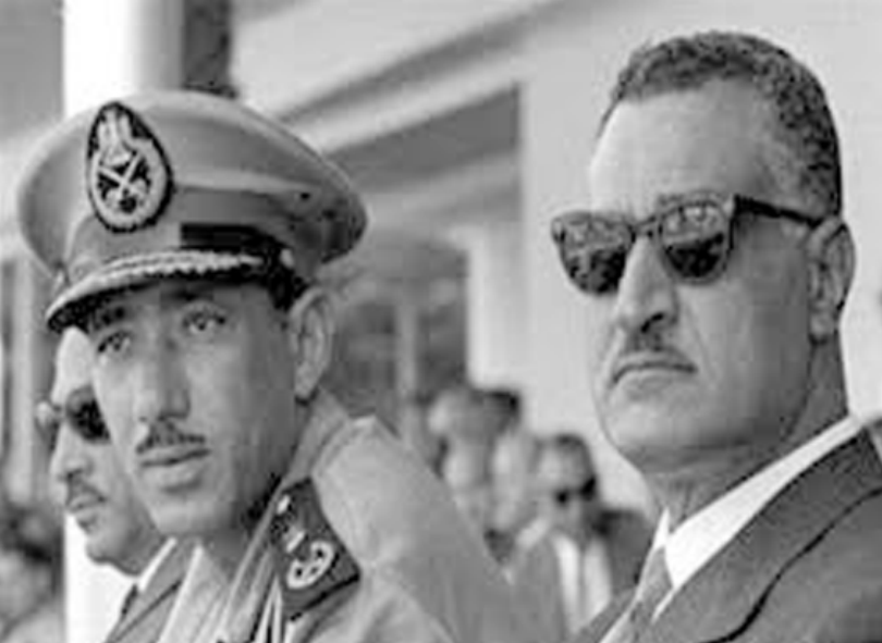
عبد الحكيم عامر مع جمال عبد الناصر