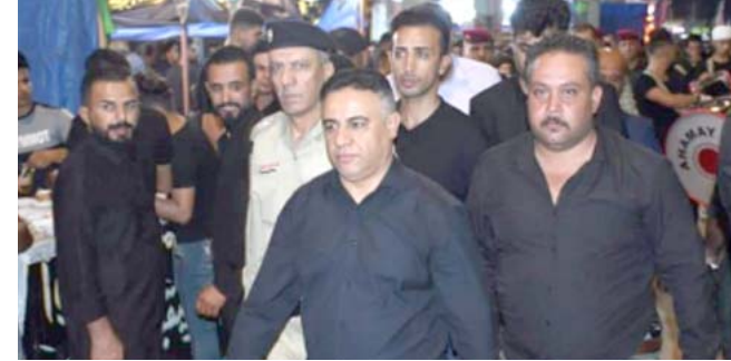
جولة : محافظ ذي قار خلال جولته بين المواكب الحسينية في المحافظة

بشكل وثيقة خطية اثناء ترميم انها المرة الأولى التي نحضر فيها ثورة الحسين واخلقاتها. عاشوراء لها مكانة خاصة لدى الأتراك الشيعة هم يعملون على احياها باسلوب حضاري بعيد عن الطائفة ليقب بقمية العبر والعاني التي تجسدها الواقعة حيث ذكرت مصادر مطلة قد أصبح الشيعة الأتراك منذ سنوات يحتفلون بهذه الذكرى بشكل علني ويمباركة من نظام حزب العدالة والتنمية والرئيس رجب طيب اردوغان الذي تحنى تقليديا جديدا حين قام بتقديم وجبة محرم وحلوى عاشوراء في القصر الرئاسي فضلا عن مساهمات وجهاء الطائفة العلوية لتناول طعام الإفطار في القصر الرئاسي وعذ هذا الأمر تطوراً لافتاً في تركيا (العلمانية) ولم يفوت النظام التقليدي العثمانية في عاشوراء فاعاد احياها وفقا للعادات التي يحافظ عليها الأتراك بتحضيرهم لحلوى خاصة جدا تعرف باسم حلوى عاشوراء حيث يتم تبادلها بين الجيران وتوزيعها في الأزقة والشرفات فضلا عن انها من الوجبات الرئيسية المجانية في الكثير من المطاعم وتوزيعها بالقرب من ضريح العمام العثماني الشهير سنان باشا باسطنبول تنفيذاً لوصيته حيث كان يعد حلوى عاشوراء في منزله التخظيم والترتيب والنظافة التي لم نعدا عند زيارتنا لمقعد الحسين عليه السلام وتم العفور على الوصية بشكل وثيقة خطية اثناء ترميم