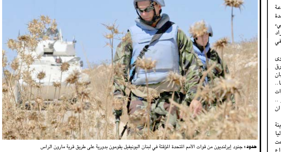
جنود إيرلنديون من قوات الأمم المتحدة المؤقتة في لبنان الينوبيل يقومون بدورية على طريق قرية مارون الرأس الحدودية

وأعلن نصرالله في كلمته الإثنين أن الجولة الأولى من الرد انتهت. وقال اليوم مقابل قتل إخواننا (في سوريا) والمسيرتين في الضاحية (... نحن الآن أمام جولة يمكن أن نقول انتهت بالمعنى التأسيسي، مؤكداً نية حزبه استهداف الطائرات المسيرة الإسرائيلية التي عادة ما تحلق في الأجواء اللبنانية. ولم تعترف إسرائيل بالهجوم على الضاحية الجنوبية بالطائرتين المسيرتين، لكنها أعلنت أنها نفذت