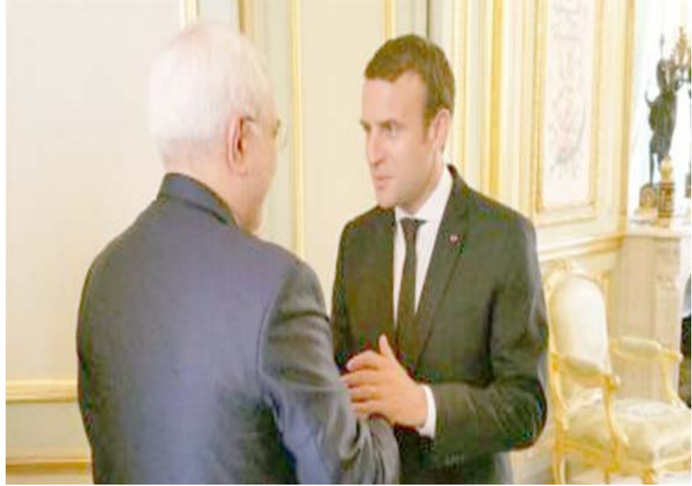
ماكرون ووزير الخارجية الإيراني جواد ظريف

اتخاذ قرار بنشر طائرات مسيرة في الخليج. وافادت القناة في تقريرها بان عمليات الاستطلاع مع استمرار السفن الحربية البريطانية في مرافقة الناقلات التي ترافق علم بريطانيا في مضيق هرمز. ودعت بريطانيا يوم الجمعة إلى دعم واسع للتصدي لتهديدات الشحن في الخليج بعدما احتجزت إيران ناقلة ترافق العلم البريطاني في المضيق في يوليو تموز.