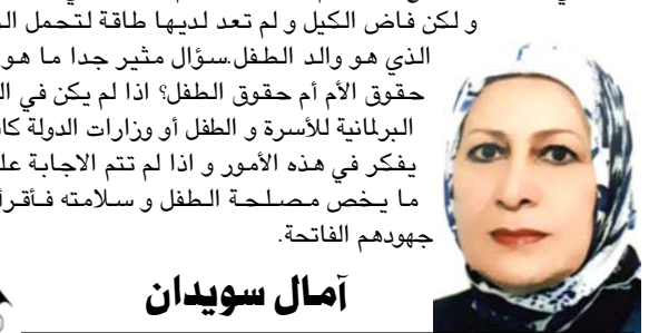
أمال سويدان بغداد

وأدت تصريحات نصرالله بعد تراجع التوتر الذي شهدته الحدود اللبنانية الإسرائيلية الأحد مع استهداف حزبه البنية عسكرية إسرائيلية على الجهة المقابلة من الحدود، في هجوم قال إنه رد على هجوميين إسرائيليين قبل أسبوع ضده في سوريا ولبنان.