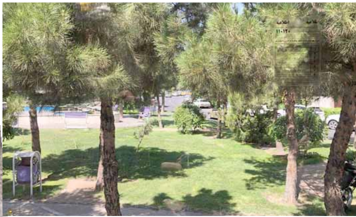
حدائق مدينة تبريز

إلى الفندق في تبريز الـ ساعة 11 ليلا. لفت انتباهي حب اهل تبريز إلى تناول العشاء في الحدائق او على الاصح في الجزيرة الوسطية. وجود الاخضرار وضياء كفيل بان يجعم العوائل المزدحمة لتناول الطعام. كما لاحظنا كثرة دور السينما في تبريز؛ احدهم قال لي (زين عدحم سينما) احبته ان الافلام الإيرانية تحصل الجوائز العالمية: كندوان تقهر الطبيعة