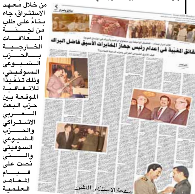
صفحة الاستكثار المنشور