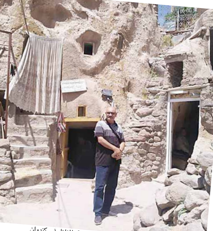
(الزمان) بين كهوف شبيهة بالنازل في كندوان

تبريز - حمدي العطار على الرغم من انني قد زرت تبريز سابقا ولكن كان ذلك في فصل الشتاء وكانوا دائما يقولون لي عليك زيارة تبريز في فصل الصيف، وحينما كانت لدي رغبة لزيارة محافظات الشمال الغربي من ايران (ارديل وكيلان غرب ورامسر) بذلك كان وجود رحلة بكرروب سياحي ينطلق من تبريز وينتهي في رامسر اعتقدت بانه مناسب لرغبتني؛ كما ان الوقت يعد مناسباً لعدة اسباب منها قلة تكلفة الرحلة وهذا يرجع إلى العقوبات الاقتصادية الأمريكية على ايران وارتفاع الدولار مقابل تومان ليصل إلى 1300 تومان للدولار الواحد، وبذلك يمكنك الوصول إلى ثمن اي سلعة ايرانية من خلال تقسيم فئتها على 10؛ السبب الاخر هو ان السياحة الطبيعية تجتلي في تلك المدن فضلا عن مدن شمال ايران وتتمتع هذه المدن بالناخ المعتدل