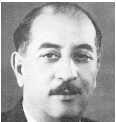
احمد حسن البكر

وقد استعري ذلك انتباهي، فسألته عن سبب رغبته باقتفاء صورة الرفيق فهو وما عساه فاعل بها، اجابني بشيء من الهزة بأنه سيقمها كونه لا يريد للمخابرات الشيوعية وسط موسكو لتنسيق العمل المخبراتي وتبادل المعلومات وغيره اخبرني بوظيفة البراك هذه مدير معهد الاستشراق السيد عفوروف، كان فاضل البراك وخلال وجوده في موسكو وعبر علاقته بمعهد الاستشراق وتكليفه بمتابعة إعداد رسالة للدكتوراه، تشييد الموضوع والصراحة في بيان معاداته للشيوعية والشيوعيين ولا سيما الحرب الشيوعي العراقي رغم معرفته بموقعي القريب من الحرب الشيوعي. وقد ذكرت في كتابي "محطات من حياتي الصادر عن دار سطور للنشر والتوزيع في بغداد عام 2018 كيف ان البراك وفي أحد المرات حضر احتفال منظمة الحزب الشيوعي العراقي في موسكو والتي اقيمت بمناسبة تأسيس الحزب، وخلال الحفل تم عرض صورة مؤسس الحزب الرفيق فهذ لإجراء مزاد عليها، فقال لي البراك بأنه يرغب بالحصول على الصورة باي ثمن كان، ولقد بدا بالمرابذة عليها ورفع المبلغ بما يؤهله الحصول عليها، وقد نال واستحوذ على الصورة، عندها طلب من سائقه وضع الصورة في الصندوق الخلفي للسيارة،