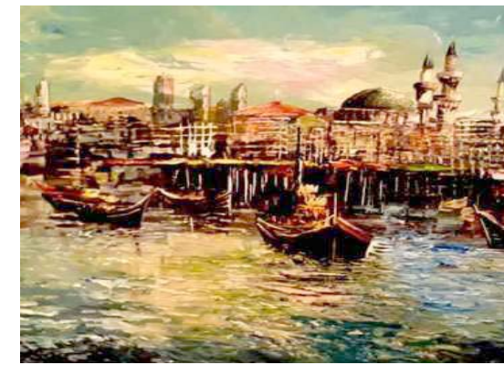
أحدى اللوحات المشاركة في المهرجان بعنوان لوحة بغداد