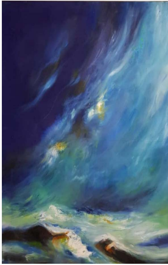
لوحة اخرى لربا قرقوط

□ لماذا اخترت ان يحمل معرضك هذا عنوان "أمواج من بوح"؟ - الموجة هي حياة، والبوح هو الشيء الذي تحب ان نرويهِ للأخرين، فحياتنا عبارة عن مد وجزر، وقد ترجمت ذلك عبر اللوحات، والموج شبيهة لحاياتنا. □ كل لوحة في هذا المعرض أنا أبوح فيها عن قصة وطريقة تشكيل اللوحة على شكل موجة، فكل لوحة تناولت قصة معينة. □ هل هذه الحكاية او القصة مرتبطة بدلالات اجتماعية؟ انت مع وجود