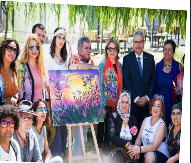
صورة تذكارية للمشاركين