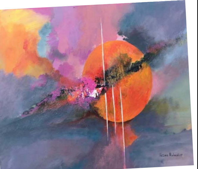
أحدى لوحات الفنانة التشكيلية فاطمة العبيدي