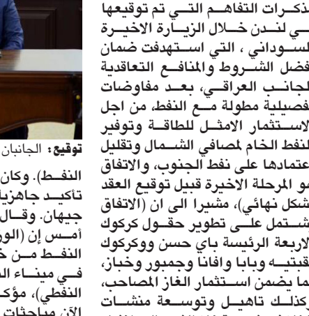
توقيع، الجانبان العراقي والبريطاني يوقعان الاتفاق

بغداد - الزمان اعرب رئيس تيار الحكمة عمار الحكيم، عن تقديره لموقف مصر في دعم القضية الفلسطينية وجهودها بمنع تهجير اهالي غزة.