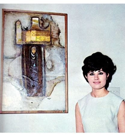
بعد أن تقاعد الفنان حافظ الدروبي بداية السبعينات ( حاصلة على دبلوم فنون من جامعة كاليفورنيا في الولايات المتحدة الأمريكية عام 1960 . لها أعمال في مجموعة من خاصة وعامة في جميع أنحاء العالم

بعد ، بما في ذلك المتحف البريطاني و مجموعة كوليبنيكيان . اقامت أكثر من عشرين معرضاً منفرداً ، بما في ذلك واحد في بغداد ، والذي أصبح أول معرض منفرد في تاريخ البلاد لسيدة فنانة . أول جائزة حصلت عليها في مهرجان بينالي الدولي بالقاهرة في عام 1984 ، وجائزة التميز في مهرجان بينالي الذي عقد في مالطا عام 1995.تداولت الأخبار بأن الملك الراحل فيصل الثاني آخر ملوك العراق قد أعجب بها وأراد أن يتقدم لخبطتها ، لكن ضوابط القصر الملكي منعت من أن تتم تلك الخلية ، حيث لا يجوز أن يتزوج الملك من عامة الشعب ، بل يجب أن يتزوج من ملكة أو أميرة بنفس سنهواته العاليي. غادرت سعاد العطار بغداد مع زوجها واولادها في عام 1976، واستقرت في لندن . كان الشعور الدائم بالحنين لـ (الوطن) يتم تعويضه بالحرية التي تنتج عن