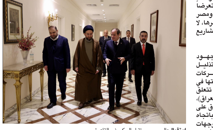
استقبال: السياسي يستقبل الحكيم في القاهرة

بغداد - ندى شوكت وقعت الحكومة العراقية، اتفاقاً مع شركة بريتش بتروليوم البريطانية، لتأهيل وتطوير حقول كركوك الأربعة، وقال بيان تلقته (الزمان) امس ان (التوقيع جرى برعاية رئيس الوزراء محمد شياع السوداني وحضور وزير النفط حيسان عبد الغني، حيث يأتي بعد الاتفاق مع الشركة المعنية بشأن القضايا الفنية والشروط التعاقدية، بضمها المويل الاقتصادي للمشروع، استناداً إلى مذكرات التفاهم التي تم توقيعها في لندن خلال الزيارة الاخيرة للسوداني، التي استهدفت ضمان افضل الشروط والمناخ التعاقدية للجانب العراقي، بعد مفاوضات تفصيلية مطولة مع النفط، من اجل الاستمرار الامثل للطاقة وتوفير النفط الخام لمصافي الشمال وتقليل اعتمادها على نفط الجنوب، والاتفاق هو المرحلة الاخيرة قبيل توقيع العقد بشكل نهائي)، مشيراً الى ان (الاتفاق يستعمل على تطوير حقول كركوك الاربعة الرئيسية باي حسن ووكركوك بقبنيه وبايا وافانا وجمبور وخباز، بما يضمن استتمرار الغاز المصاحب، وكذلك تأهيل وتوسعة منشآت الغاز في شركة غاز الشمال وانشاء محطة كهرباء بطاقة 400 ميكا واط لتحقيق الاهداف المرجوة من هذا المشروع الاستراتيجي المتكامل، وتابع البيان ان (هذا المشروع سوف يستيعاب الاسدي العاملة بمختلف التخصصات، وتشغيل الشركات المحلية، وتنفيذ مشاريع المناهج الاجتماعية، وتطوير مهارات الموارد الهندسية والفنية، المساندة لملاكات شركة نفط الشمال، وشركة غاز الشمال، ضمن رؤية الحكومة لبرامج التدريب ورفع مستوى الكفاءات في اطار ما توفره بريتش بتروليوم، بالتنسيق مع وزارة