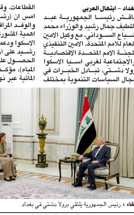
لقاء ، رئيس الجمهورية يلتقي بولا دشتي في بغداد

بغداد - ايهال العربي ناقش رئيسا الجمهورية عبد اللطيف جمال رشيد والوزراء محمد شياع السوداني، مع وكيل الامن العام للامم المتحدة، الامين التنفيذي للجنة الامم المتحدة الاقتصادية والاجتماعية لغربي اسيا الاسكوا رولا دشتي، تبادلاً الخبرات في مجال السياسات التنموية بمختلف