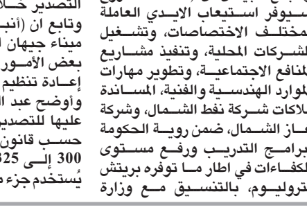
لقاء ، رئيس الجمهورية يلتقي بولا دشتي في بغداد

بغداد - ايهال العربي ناقش رئيسا الجمهورية عبد اللطيف جمال رشيد والوزراء محمد شياع السوداني، مع وكيل الامن العام للامم المتحدة، الامين التنفيذي للجنة الامم المتحدة الاقتصادية والاجتماعية لغربي اسيا الاسكوا رولا دشتي، تبادلاً الخبرات في مجال السياسات التنموية بمختلف