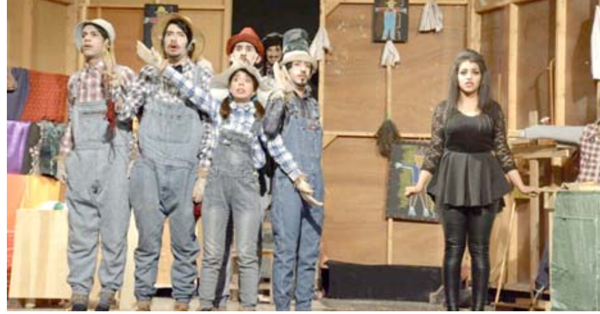
طلبة الفنون؛ مشاهد من مسرحية (كوتنرول)