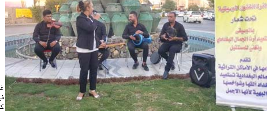
غناء وموسيقى في ساحة كهرمانة

بغداد - تضامن عبدالحسن تحت شعار (بالموسيقى.. نستعيد اراث الجمال البغدادي ونخفي للمستقبل) تواصل دائرة الفنون