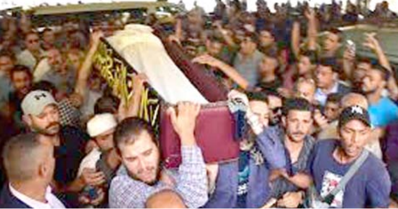
جمهور كبير يشارك في تشييع فاروق الفيشاوي

شيع الفنانون في مصر الممثل فاروق الفيشاوي الذي توفي في ساعة مبكرة من يوم الخميس الماضي عن 67 عاما بعد صراع مع مرض السرطان لم يستمر أكثر من عام. حضر الجنازة التي انطلقت بعد صلاة الظهر من مسجد