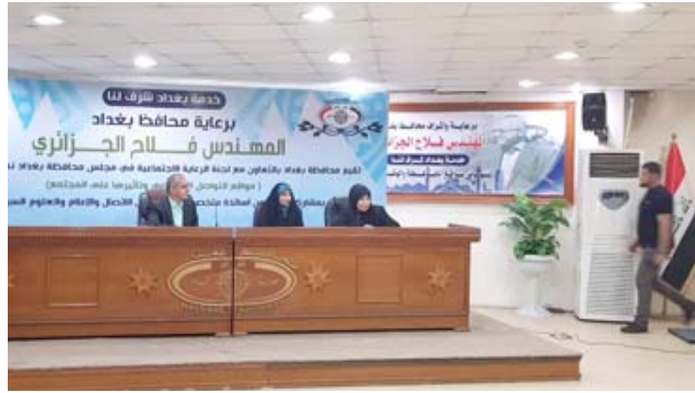
ندوة: محاضرون على منصة ندوة محافظة بغداد