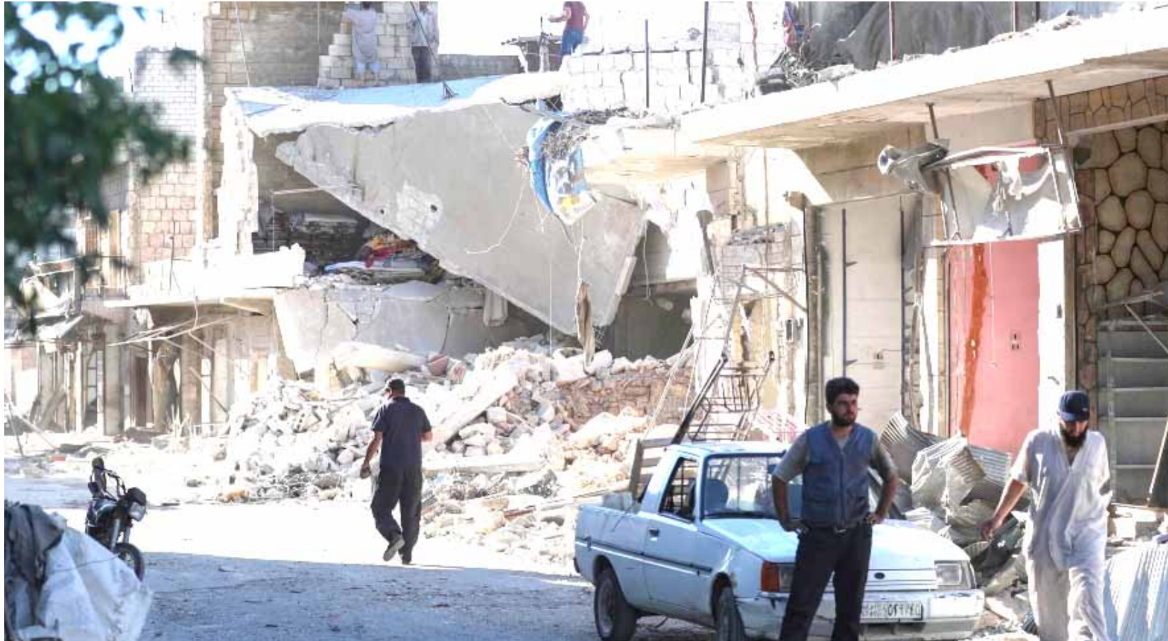
غارات : اثار الغارات الجوية التي ضربت منازل شمال غرب سوريا

بيروت) ، ف (ب) - قتل تسعة مدنيين الخلاء في غارات جوية مستمرة تستهدف محافظة ادلب في شمال غرب سوريا، وفق ما أفاد المرصد السوري لحقوق الإنسان. وتعرض محافظة ادلب ومناطق محاذية لها، حيث يعيش نحو ثلاثة ملايين نسمة، لتصفيد في القصف السوري والروسي منذ أكثر من شهرين، يتزافق مع معارك عنيفة تتركز في ريف حماة الشمالي. وأفاد المرصد السوري أن طائرات قوات النظام استهدفت قرية معرثوسين في ريف ادلب الجنوبي، ما أسفر عن مقتل تسعة مدنيين بينهم ثلاثة أطفال، مرجحاً ارتفاع الحصيلة لوجود جرحى في حالات خطيرة. غارات جوية وشنت الطائرات الحربية السورية والروسية الخلاء على مناطق عدة تمتد من ريف ادلب الجنوبي إلى حماة الشمالي. وتمسك هيئة تحرير الشام (جبهة النصرة سابقاً) بزمام الأمور إدارياً وعسكرياً في محافظة ادلب ومحيطها، حيث تتواجد أيضاً فصائل إسلامية ومقاتلة أقل نفوذاً. ومنذ بدء التصعيد نهاية نيسان ، قتل أكثر من 600 مدني جراء الغارات السورية والروسية، فيما قتل 45مدنياً في قصف للفصائل المقاتلة والجهادية على مناطق سيطرة قوات النظام القريبة، وفق المرصد السوري. ويتزافق القصف مع استمرار الاشتباكات بين قوات النظام والفصائل الإسلامية والمقاتلة وعلى رأسها هيئة تحرير الشام في ريف حماة الشمالي. وكانت محافظة ادلب ومحيطها شهدت هدوءاً نسبياً بعد توقيع