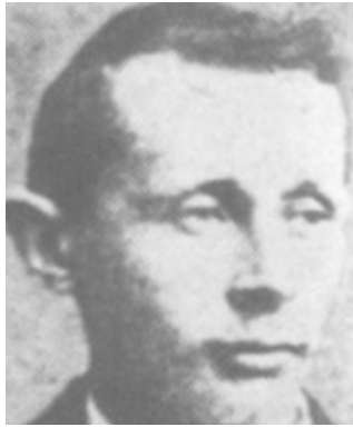
جارلس هنري كولي

انتهت بالافراج عن الركاب الرهائن بعد خضوع الحكومة الاسرائيلية لشروطه بالافراج عن اسرى فلسطينيين. واتهمته الموساد بأنه وراء العملية التي قام بها الجيش الاحمر الليباني والتي انتهت بمذبحة في مطار بن غوريون في تل ابيب عام 1972.