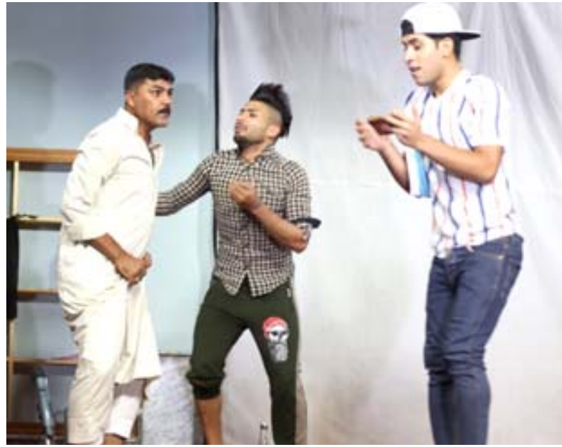
عمل جديد: فنانو واسط يقدمون (مصباح ومفتاح) على خشبة بغدادية