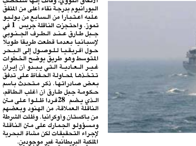
سفن بحرية إيرانية في مياه الخليج

الأمم المتحدة عن تنفيذ ضربات جوية ضد طهران في اللحظة الأخيرة وتلقي حليف وثيق لواشنطن في خضم أزمة سعت فيها القوى الأوروبية جاهداً أن تبدو محايدة، وقالت متحدثة باسم وزارة الخارجية الأمريكية نرحب بتصميم الشركات الدوليين على الالتزام بالتعهدات وتطبيقها، واستدعت طهران السفير البريطاني يوم الخميس للتعبير عن احتجاجها القوي على الإحتجاز غير المقبول والمخالف للقانون وهي خطوة بددت أيضا للشكوك في ملكية السفينة. قال المتحدث باسم وزارة الخارجية عباس موسوي إن شحنة النفط الخام كانت