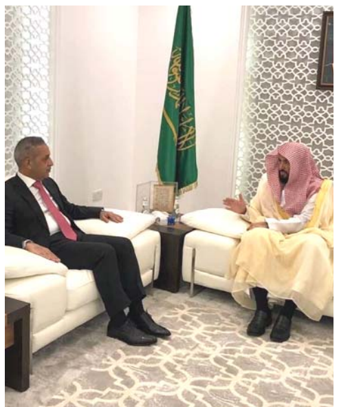
زيارة: رئيس مجلس القضاء الأعلى خلال زيارته إلى الرياض

الرياض - الزمان استقبل وزير العدل رئيس المجلس الأعلى للقضاء السعودي وليد بن محمد الصمغاني في مكتبه بالرياض، رئيس مجلس القضاء الأعلى فائق زيدان، لبحث سبل التعاون القضائي بين البلدين، ورحب وزير العدل بزيارة زيدان مشيداً بالعلاقات المتينة والمتراصة بين البلدين التي تاتي امتداداً من رغبة واهتمام قيادة البلدين بتطوير العلاقات الثنائية وتفعيلها بما يصب في مصلحة البلدين، وجرى خلال الاستقبال تبادل وجهات النظر حول سبل تعزيز التعاون في المجال العدلي والقضائي بين البلدين إضافة إلى عدد من الموضوعات ذات الاهتمام المشترك. وقالت الصحف السعودية امس ان الصمغاني عرض خلال الاستقبال مسيرة القضاء في المملكة منذ بداياته وكيف تحول إلى قضاء مؤسسي متخصص من خلال الجهود التي